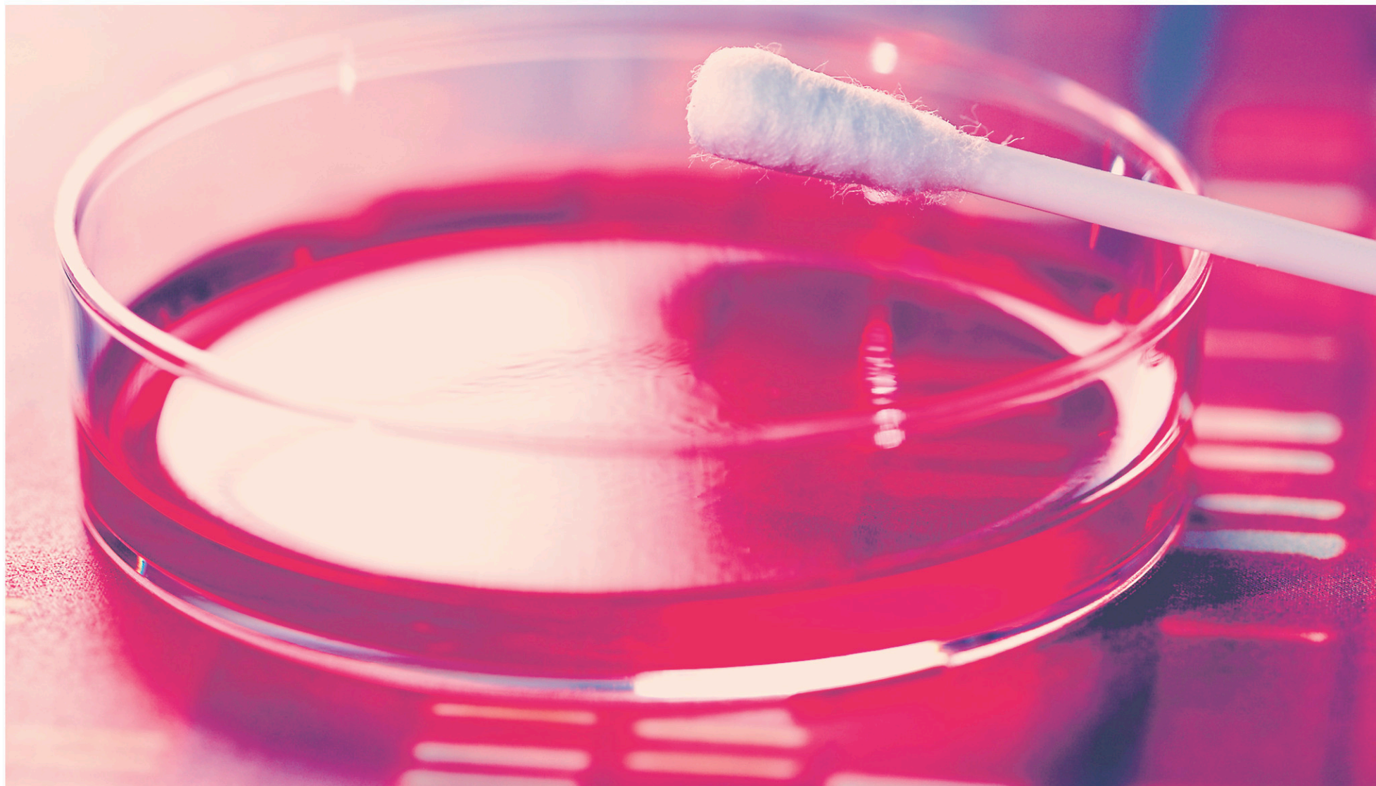
Les tests d'ADN ont permis de prouver que Orlando Polania-Castano est celui qui a mis Marie enceinte, mais la Couronne n'a toutefois aucune preuve incriminante contre les autres fêtards présents à la même soirée.