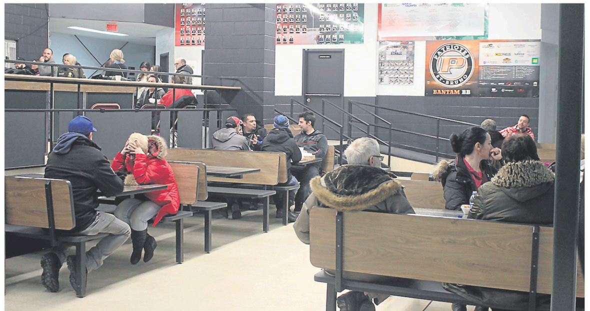
Des dizaines de personnes attendaient depuis plusieurs heures au centre d'hébergement d'urgence de Saint-Bruno.