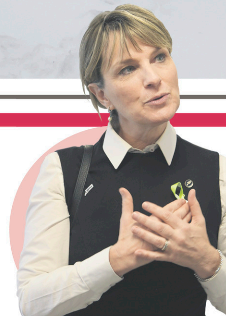
ARCHIVES LE QUOTIDIEN, MARIANE L. ST-GELAIS