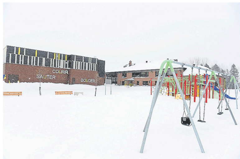
Toutes les écoles primaires et secondaires de la région avaient suspendu leurs cours, lundi.

« Toutefois, même si on devait dépasser nos limites, c'est certain qu'on ne mettrait pas la sécurité des élèves et du personnel simplement parce qu'il n'y a plus de journées disponibles au calendrier », a-t-elle précisé.