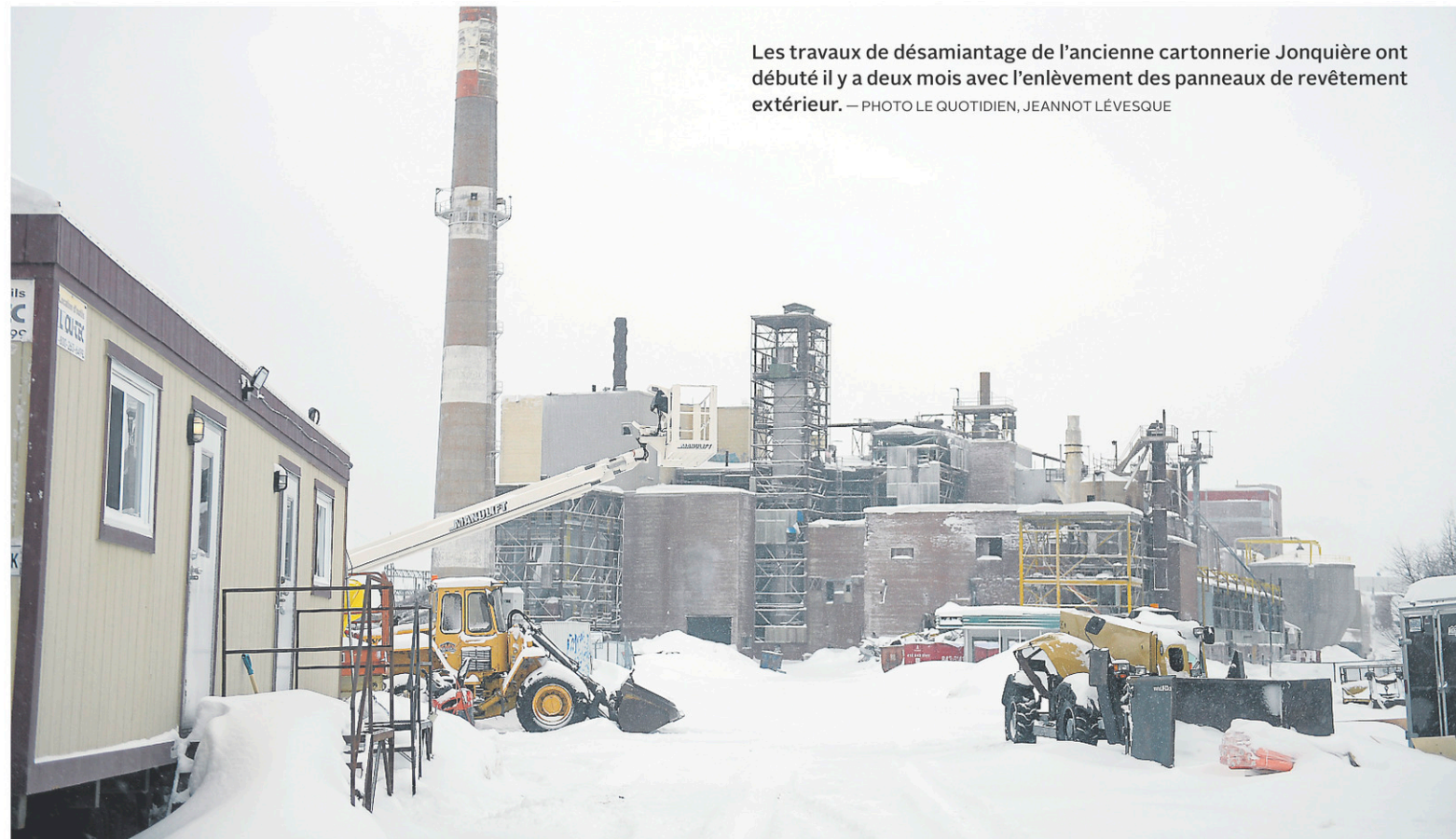
Les travaux de désamiantage de l'ancienne cartonnerie Jonquière ont débuté il y a deux mois avec l'enlèvement des panneaux de revêtement extérieur.

Une fois démolie, l'usine dont le sol aura été décontaminé laissera un terrain vague de 680 708 mètres carrés donnant sur les rives de la rivière aux Sables. Le terrain est actuellement en vente. Le courtier responsable n'a pas retourné notre appel.