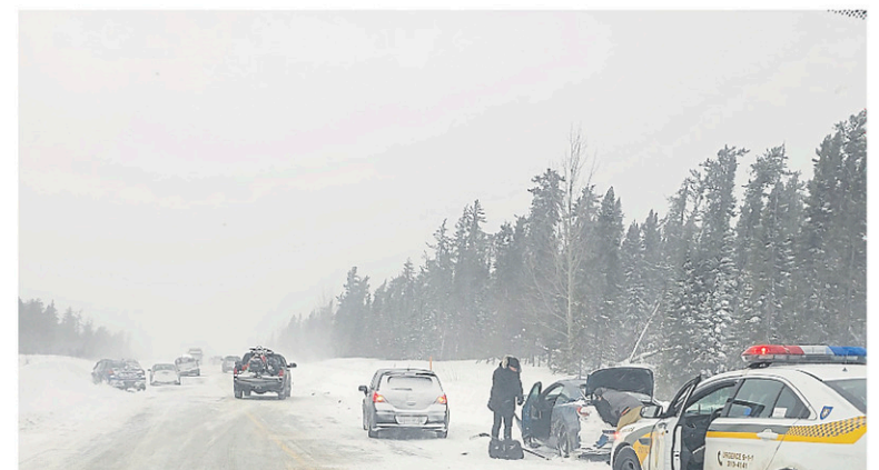
L'accident a provoqué un ralentissement sur la route 167.

mais Hélène Nepton a indiqué en fin de soirée qu'on ne craignait pas pour la vie de la conductrice. La circulation a été perturbée, le temps de dégager les véhicules impliqués.