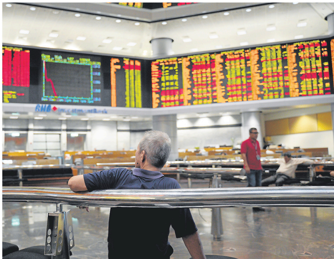
Sur le marché des devises, le dollar canadien s'est négocié au cours moyen de 75,91 cents US, inchangé par rapport à son cours moyen de vendredi.