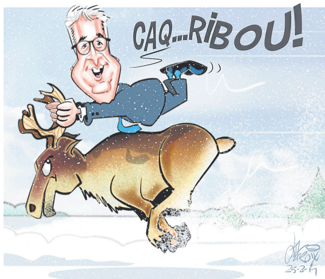
Mario Lacroix, Le Quotidien