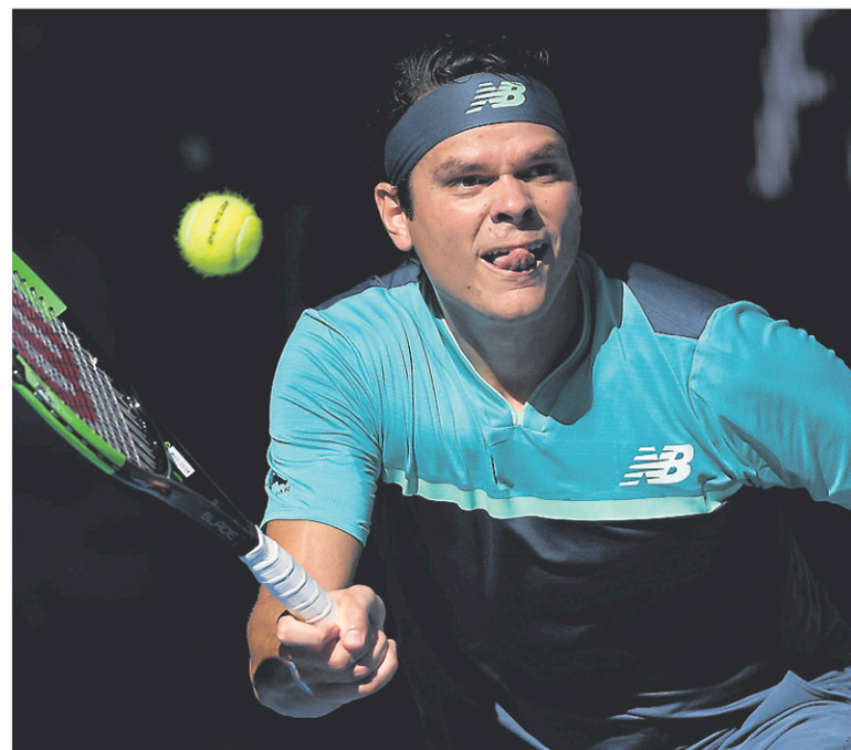
Milos Raonic a subi une défaite-surprise de 6-4, 5-7, 6-4 aux mains de l'Allemand Jan-Lennard Struff, en première ronde du Championnat de Dubaï.

Chez les dames, l'Ontarienne Bianca Andreescu reprend ses activités mardi au tournoi d'Acapulco, où elle a rendez-vous avec la Suisse Jil Teichmann. (AVEC L'ASSOCIATED PRESS)