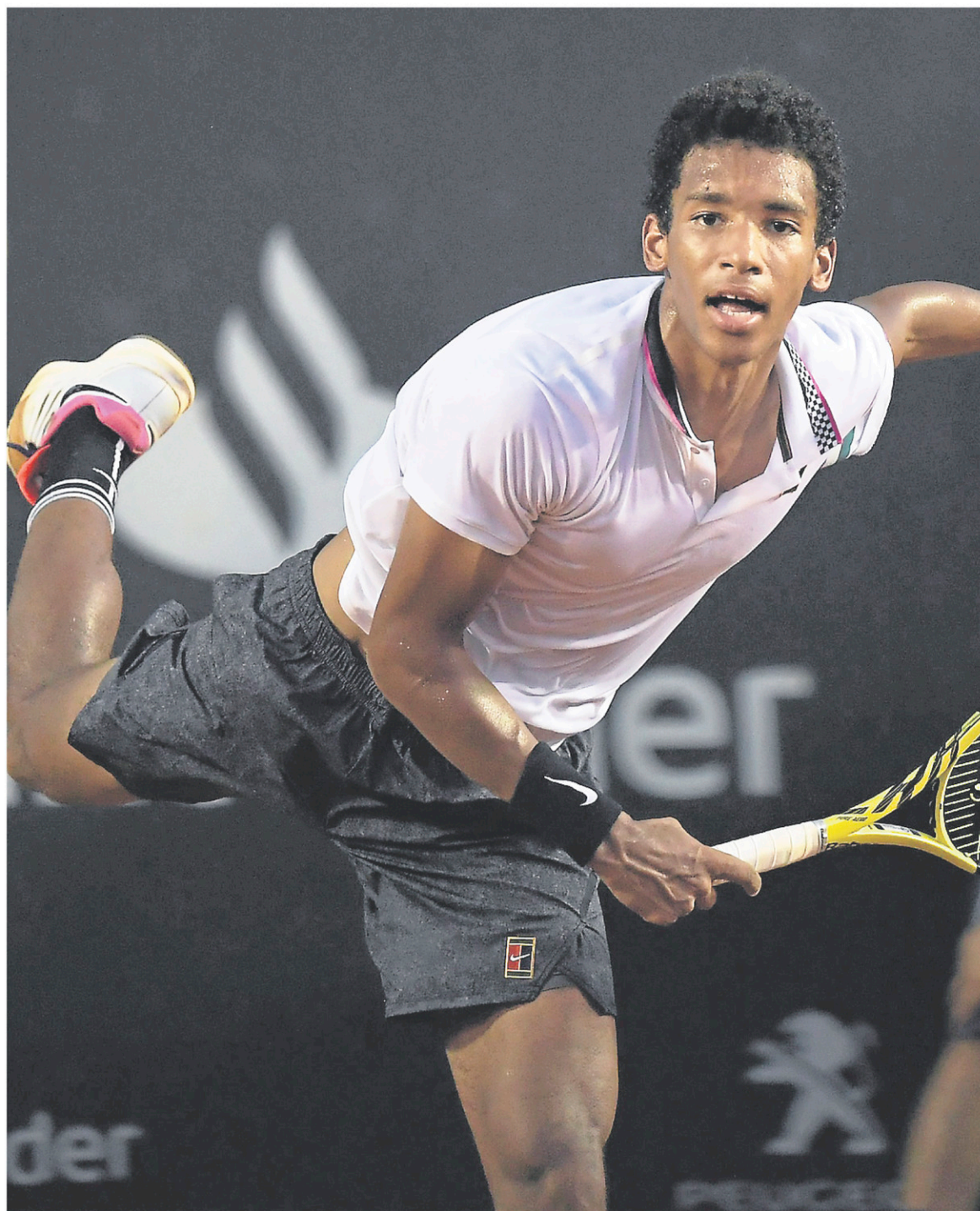
L'athlète de L'Ancienne-Lorette Félix Auger-Aliassime a fait un bond de 44 places dans le classement de l'ATP grâce à sa présence en finale du Tournoi de Rio, dimanche.