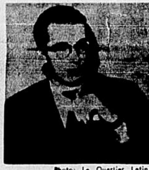
Un acte de naissance

Montréal (PEN) — Le congrès de fondation de la Fédération des coopératives étudiantes du Québec s'est tenu à l'École des Hautes Etudes commerciales, à Montréal, le samedi 26 mars. Une douzaine de coopératives étudiantes de tout le Québec ont participé à ces assises, dont les coopératives les plus importantes: celle de l'AGEUM, celle des HEC, celle du Collège de Saint-Hyacinthe et la Coopérative des publications Jeunes-Québec, qui édite le journal DESORMAIS.