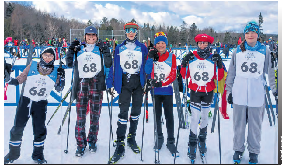
L'équipe relais du Club Défi.