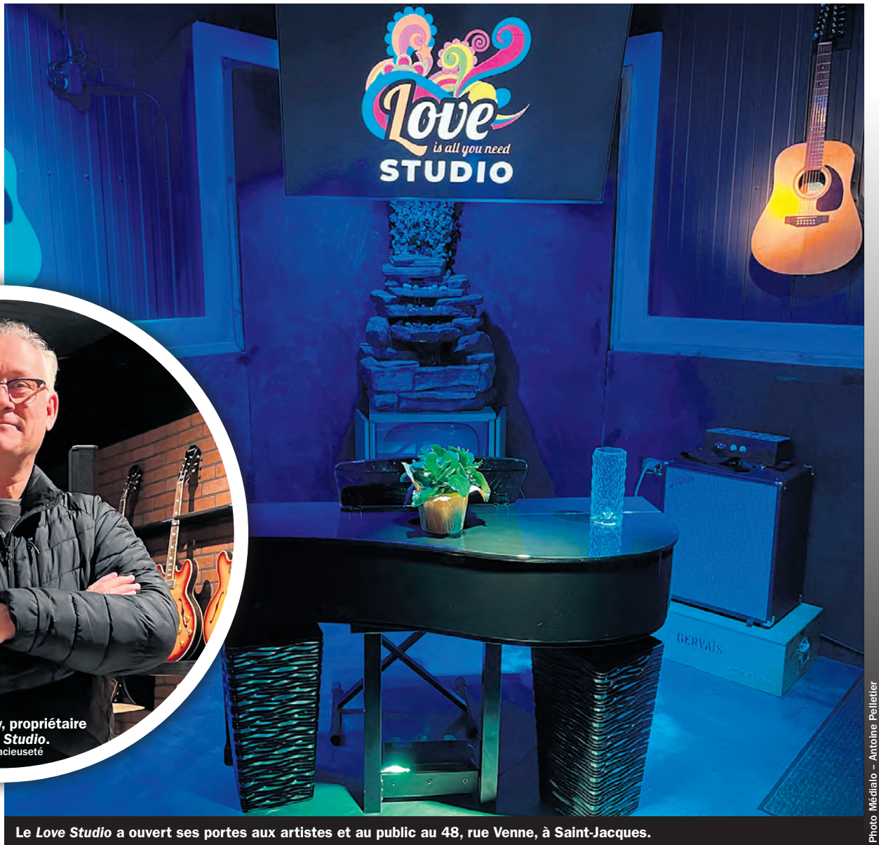
Le Love Studio a ouvert ses portes aux artistes et au public au 48, rue Venne, à Saint-Jacques.

« Bien sûr, la musique est mise de l'avant, mais on accueille aussi des humoristes par exemple, ou des gens