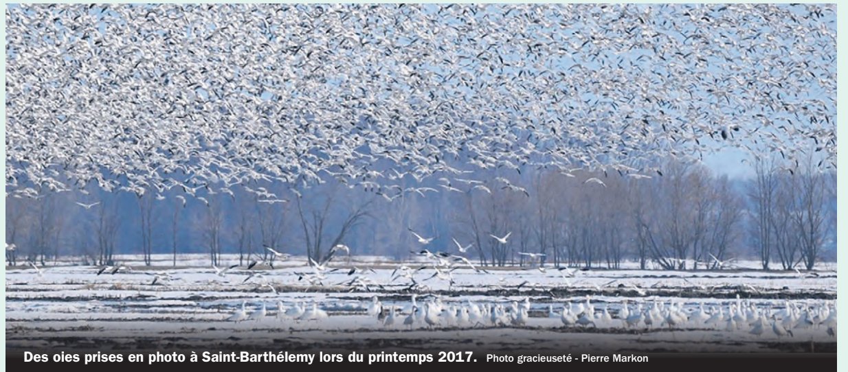
Des oies prises en photo à Saint-Barthélemy lors du printemps 2017.