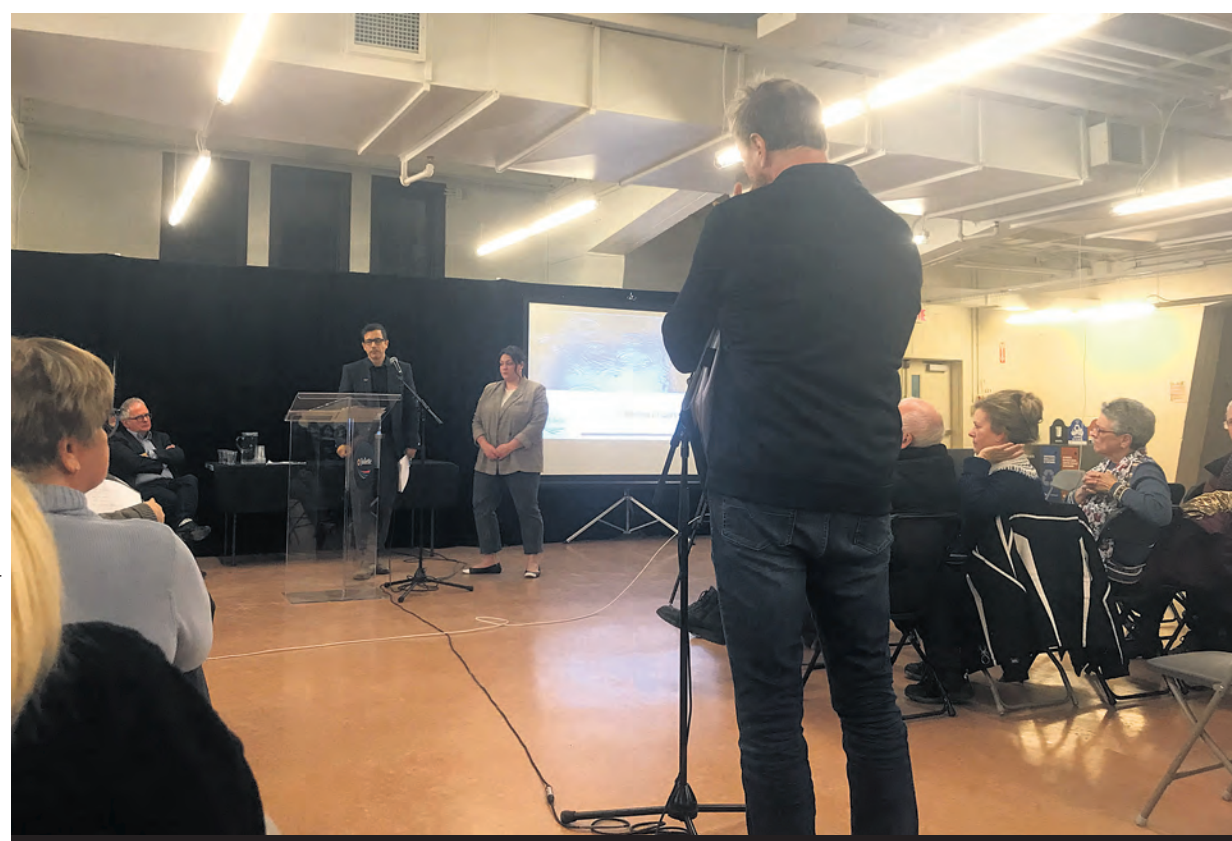
Beaucoup de citoyens ont été surpris d'apprendre que le programme d'aide financière servirait seulement à payer une partie des frais d'inspection des installations des eaux usées.

La Ville a également profité de la consultation publique pour annoncer son programme d'aide financière pour la réhabilitation des systèmes de rejets d'égouts. Applicable à l'ensemble des résidences admissibles du territoire joliettain, il consiste en la couverture de 50% des frais pour l'inspection et le diagnostic des systèmes, jusqu'à concurrence de 375 $. L'aide financière ne servirait donc pas pour la réparation ou le remplacement des installations, mais plutôt pour connaître les lacunes des bâtiments.