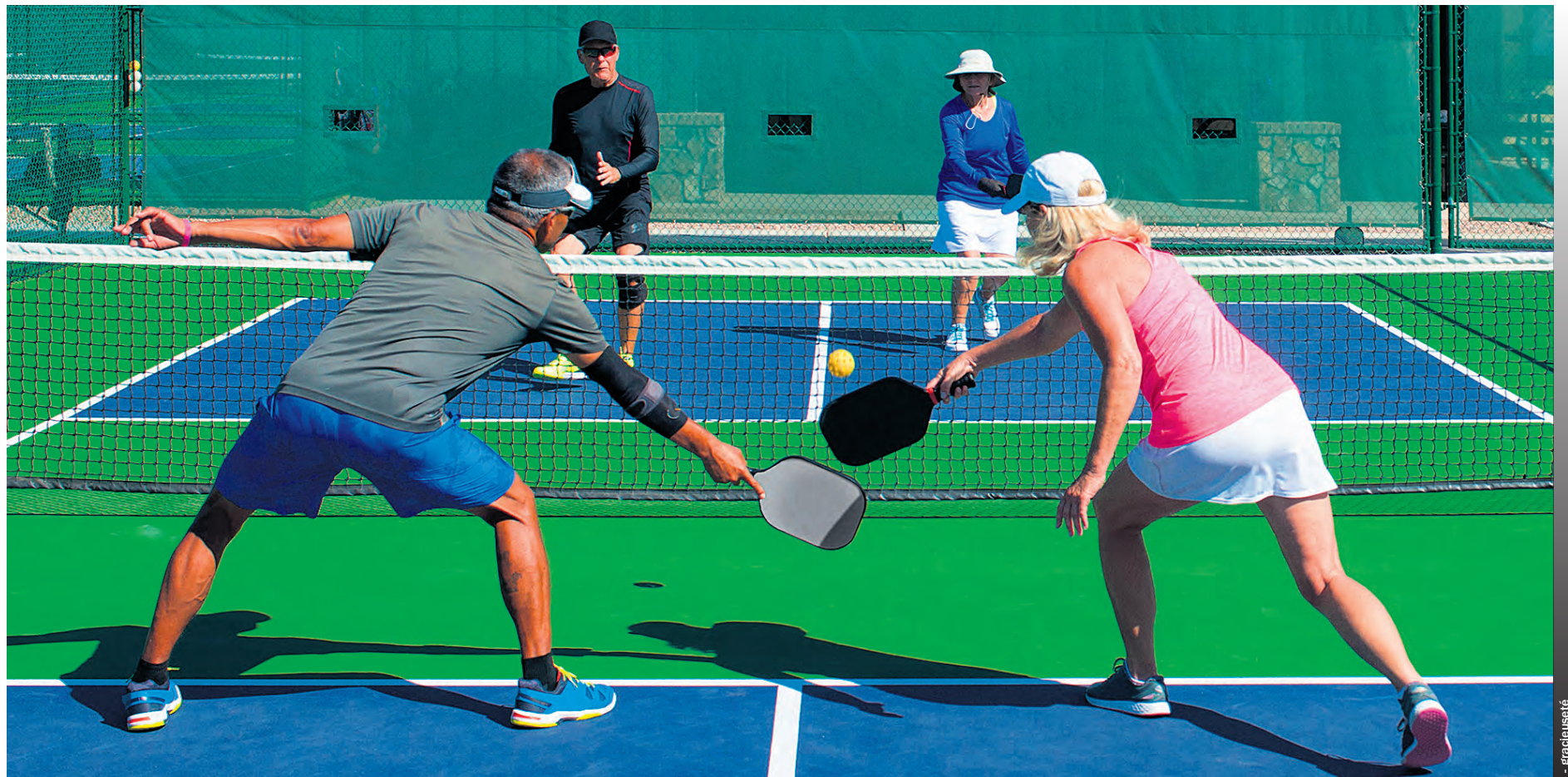
Du pickleball se tiendra aussi du côté de Terrebonne et de Mascouche les 21 et 25 mai.