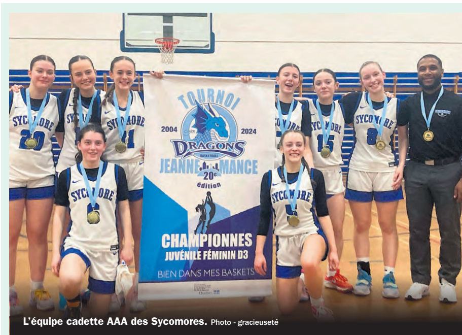
L'équipe cadette AAA des Sycomores.