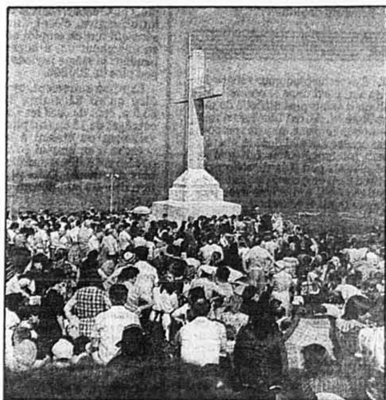
Où la Vierge serait apparue.

Thérèse LECLERC STENSLAND Deux-Montagnes