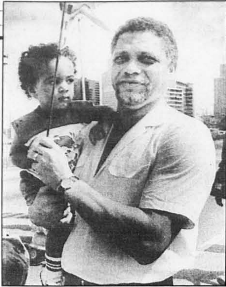
Mickey Leland et son fils Jarrett dans une photo prise lors d'une parade à Houston.