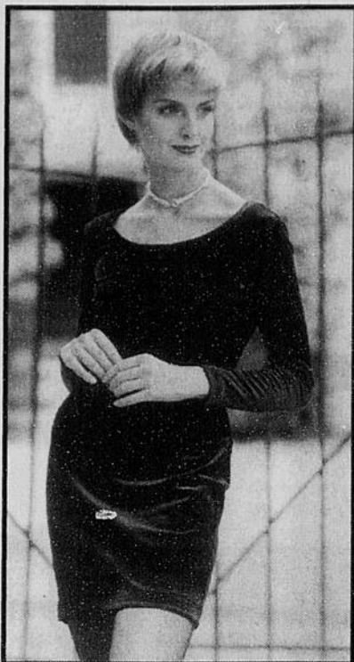
DÉSIR: velours glamour

TRADITION : réinterpréter les classiques