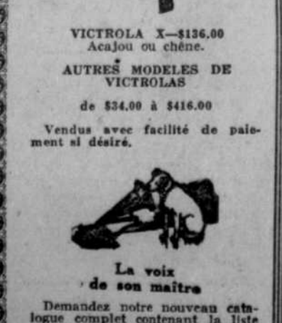
La voix de son maître

FOISY & FRERES INCORPORÉE 210-216 rue Sainte-Catherine Est Tél. Est 1644. Angle Sanguinet