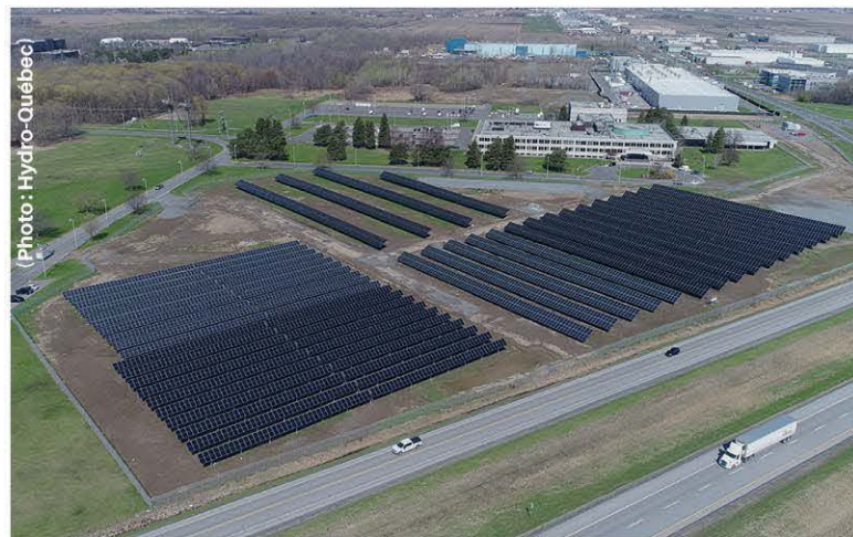
Les deux installations ont une puissance combinée de 9,5 mégawatts (MW) et permettront de produire près de 16 gigawattheures (GWh) d'énergie solaire par année, soit l'équivalent de la consommation de 1 000 clients résidentiels.

La dirigeante a rappelé que ces deux centrales comptent au total 30 600 panneaux solaires qui permettront à Hydro-Québec de déterminer si l'énergie solaire est bien adaptée au climat du Québec, à son parc de production et à son réseau de transport. Certains des panneaux seront mobiles afin de suivre la course du