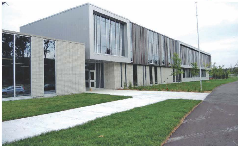
L'école des Cœurs-Vaillants est un peu le symbole de l'augmentation constante de la population contrecœuroise au fil des ans, car elle a été construite en 2015 et elle en est déjà à son deuxième agrandissement.