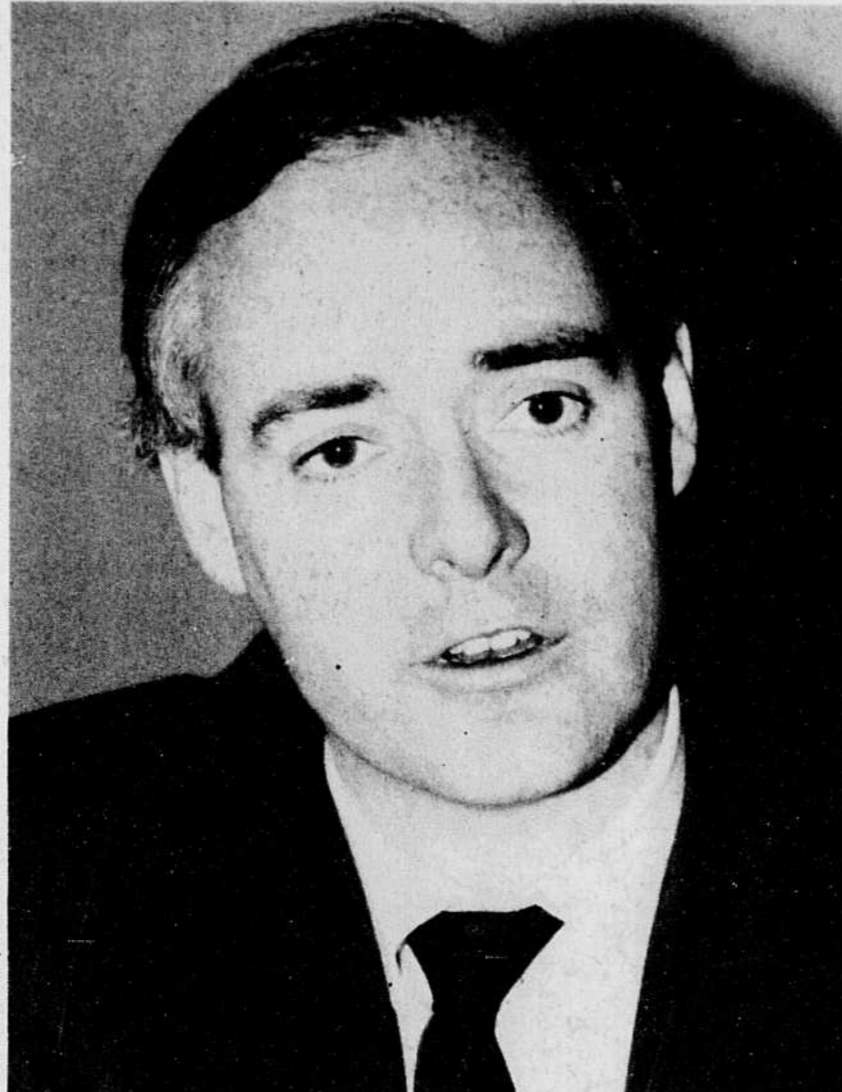
«On ne parle plus ici du développement des programmes sociaux mais de leur maintien», a déclaré hier le ministre Perrin Beatty en appuyant sans réserve la TPS, au cours d'une entrevue à LA TRIBUNE.

Et le titulaire de la Santé nationale de citer le cas des maladies cardiovasculaires ainsi que des maladies reliées au tabagisme, à l'alcoolisme et aux autres toxicomanies pour lesquelles la société canadienne doit déboursé quelque 10 milliards $ par année.