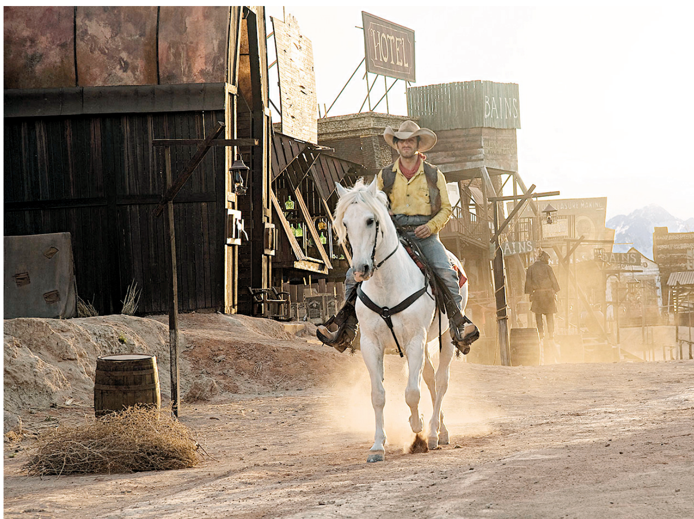
Jean Dujardin dans le rôle-titre de Lucky Luke