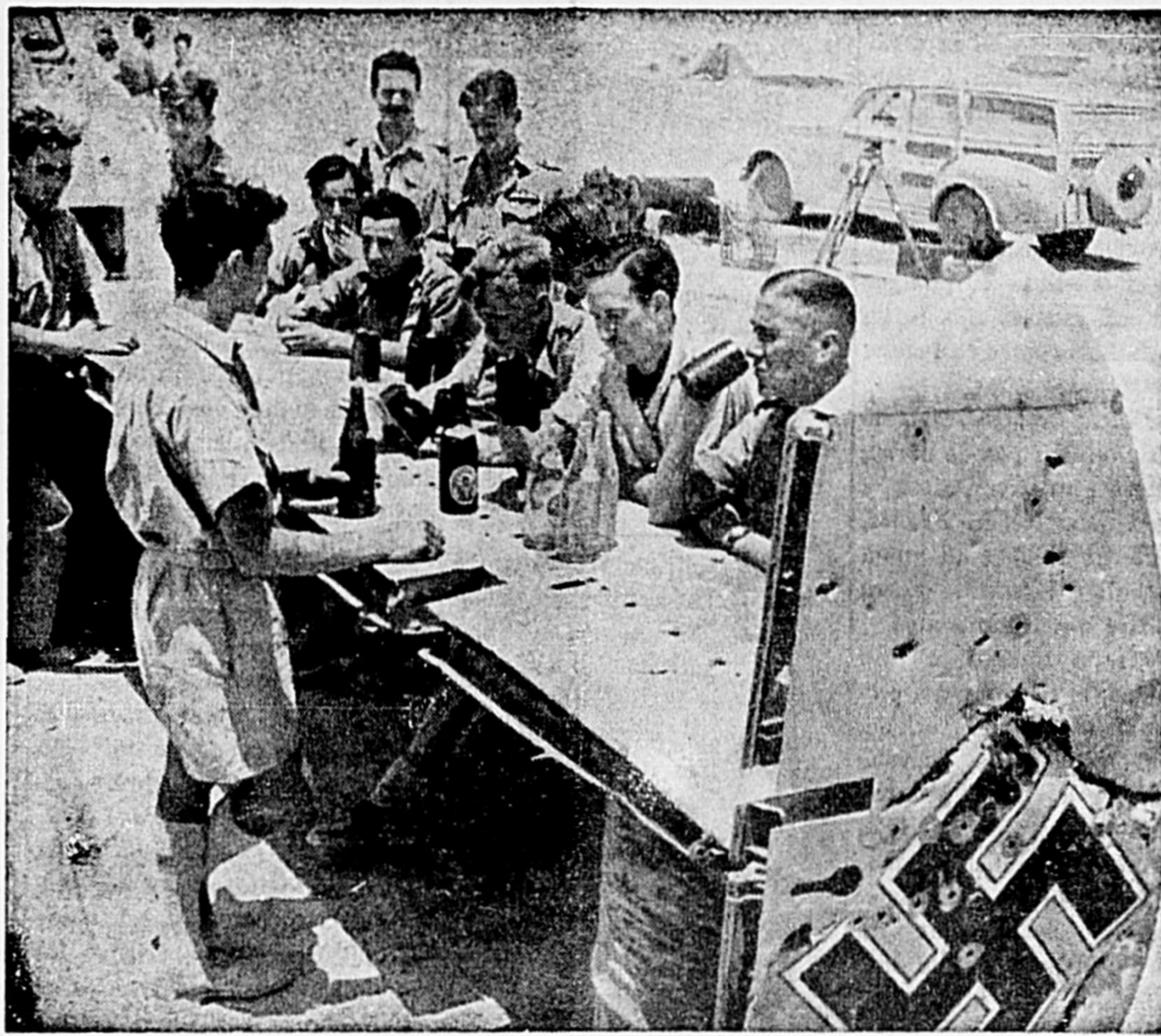
L'empennage d'un Messerschmitt (Nazi) 110 troué de balles sert ici de table au mess temporaire des officiers d'une célèbre escadrille de combat canadienne-britannique dans un désert de l'Afrique occidentale. L'avion ennemi avait été abattu par un membre de l'escadrille quelques jours auparavant.