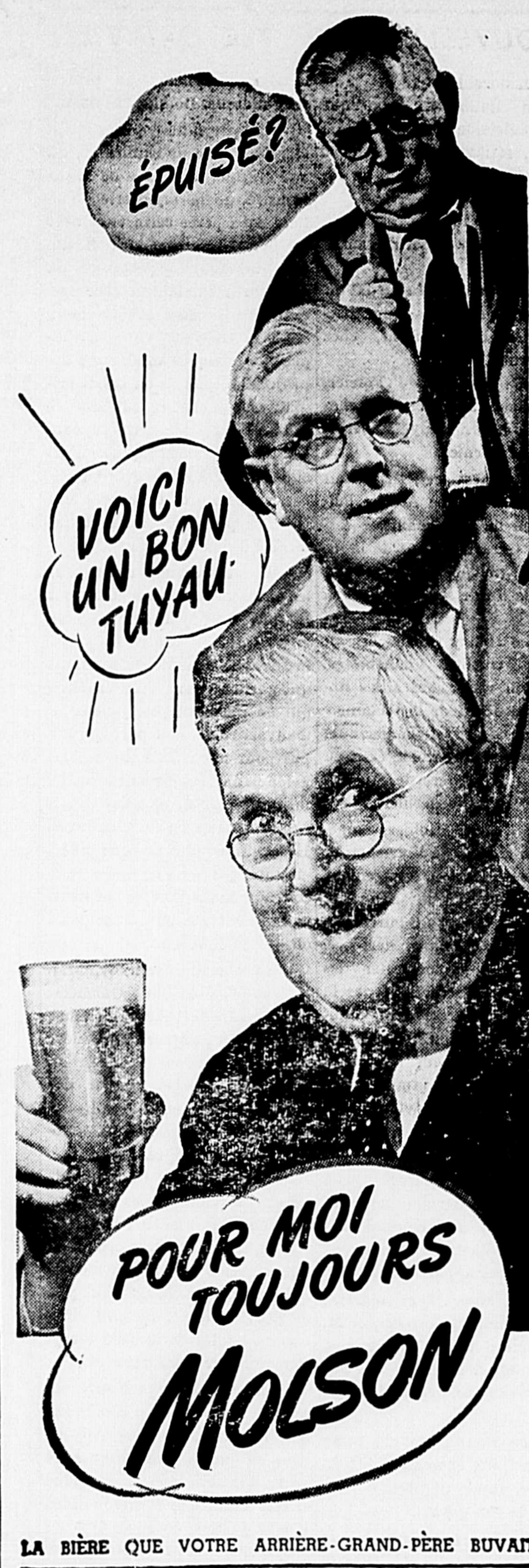
LA BIÈRE QUE VOTRE ARRIÈRE-GRAND-PÈRE BUVAIT

Après les funérailles le corps a été conduit au cimetière paroissial où il repose dans le lot de la famille, à côté de son époux, au pied du monument funéraire érigé sur la tombe du chef de la famille. C'est là que tous ceux qui ont eu l'avantage de la connaître et d'apprécier ses qualités de cœur et d'esprit pourront contempler à jamais les restes mortels de celle qui n'a pu survivre à la sentence du Divin Maître: "Tu es poussière et tu retourneras en poussière". R. I. P.