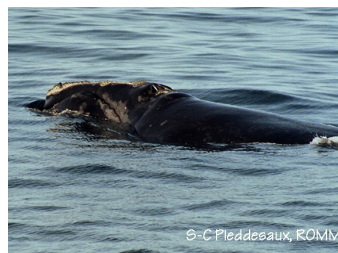
S-C Pleddesaux, ROMM

Depuis 1995, de plus en plus d'observations sont signalées en été dans le golfe du Saint-Laurent au sud de la péninsule gaspésienne, entre Chandler et Percé, et très occasionnellement en amont du golfe.