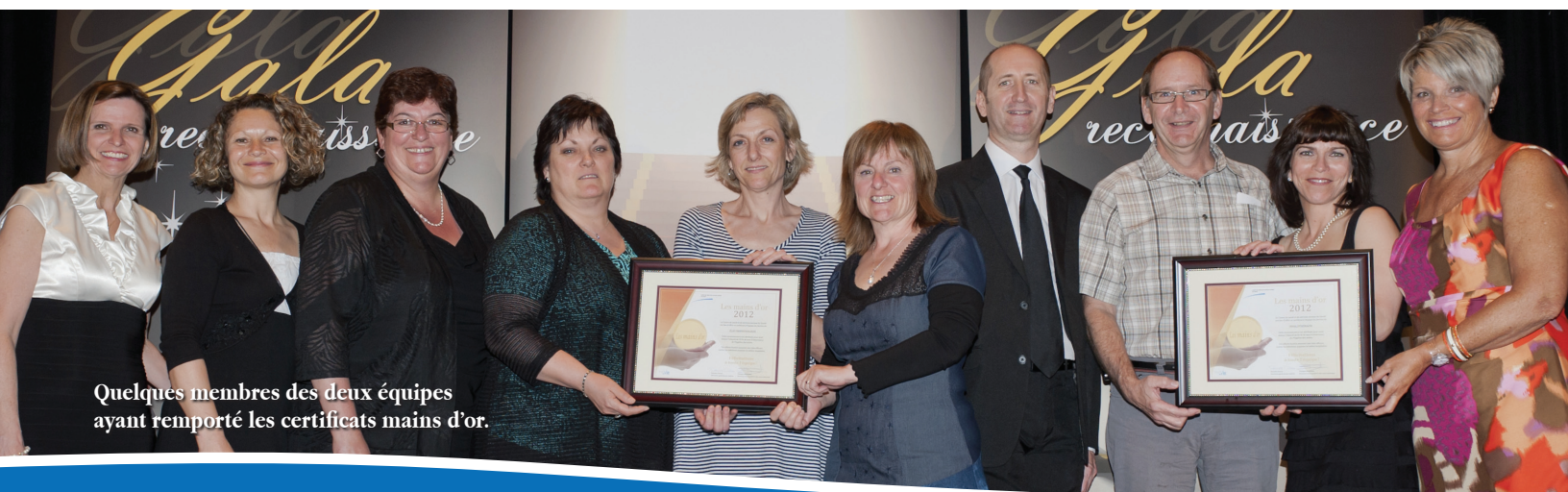
Quelques membres des deux équipes ayant remporté les certificats mains d'or.

Gériatrie active 67 % RFI 67 % Soins intensifs 61 % 8 e médecine 60 %