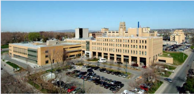
L'Hôpital de l'Enfant-Jésus en 2008.

Un dossier qui a également suscité l'attention en matière de défense des intérêts est celui de la relocalisation du Centre d'hémophilie de l'Est du Québec, situé à l'Hôpital de l'Enfant-Jésus, dans le cadre de la transformation de ce dernier en Nouveau complexe hospitalier.