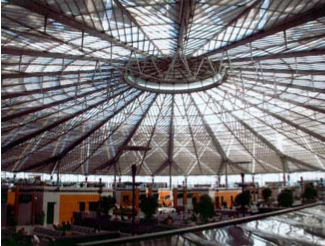
Gare de Shanghai-Sud

La Chine retient beaucoup l'attention des médias en particulier à cause de sa situation politique. Mais ce pays est mystérieux en soi car il propose à ses visiteurs l'ancien et le moderne entourée d'un population évaluée à plus de 1,3 milliards. Jacques Robert a souvent voyagé dans cette région du monde et il nous propose ici une visite de la gare de Shanghai-Sud, un endroit qui sort de la tradition.