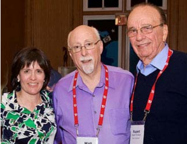
Kara Swisher, Walt Mossberg et Rupert Murdoch

Le journal américain The Wall Street Journal a réussi un coup de maître en présentant la conférence D6 All Things Digital . Ce grand événement est l'oeuvre de Walt Mossberg et Kara Swisher et il a réuni sur une même scène tous les leaders de l'heure au niveau des médias et de la technologie. La conclusion: le monde des communication est devenu une grande tribune mondiale occupée par des éditeurs géants comme Google et les petits créateurs de contenu que sont tous les internautes de ce monde. On peut visionner les reportages de la conférence sur le site Internet de D6 . Nous accordons une mention d'excellence aux organisateurs de D6 dans la galerie Les Meilleurs LeStudio1.com .