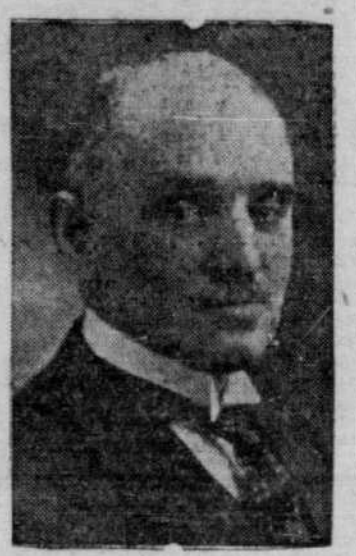
L'hon. P.-J.-A. CARDIN, président honoraire de l'Association du Barreau Rural, a présidé samedi l'ouverture de la réunion annuelle de cette association à Rivière-du-Loup.