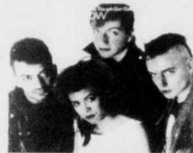
Parmi les groupes britanniques à succès, Bow Wow Wow.

Les ventes de disques en Grande-Bretagne sont en hausse (5 pc), la musique britannique se vend deux fois plus à l'étranger qu'au Royaume Uni, et les artistes britanniques peuvent se vanter d'avoir occupé plus de 35 pc des palmarès américains en 1983.