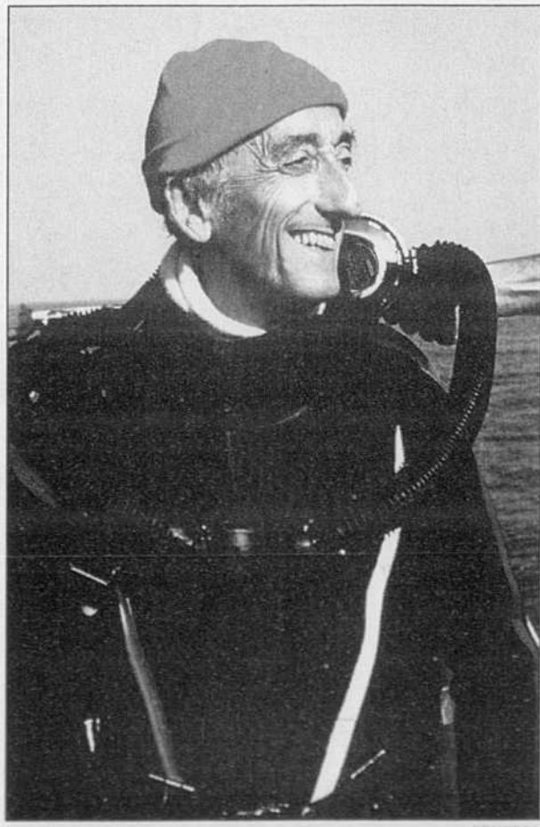
«Cousteau représentait la part de rêve au cœur de chacun de nous», a déclaré hier le président français, Jacques Chirac.

Le commandant français Jacques Cousteau, explorateur, écologiste avant l'heure et cinéaste dont la mythique frégate La Calypso a fendu l'écumé de toutes les mers du monde pendant 40 ans, a rejoint hier le monde du silence, à l'âge de 87 ans.