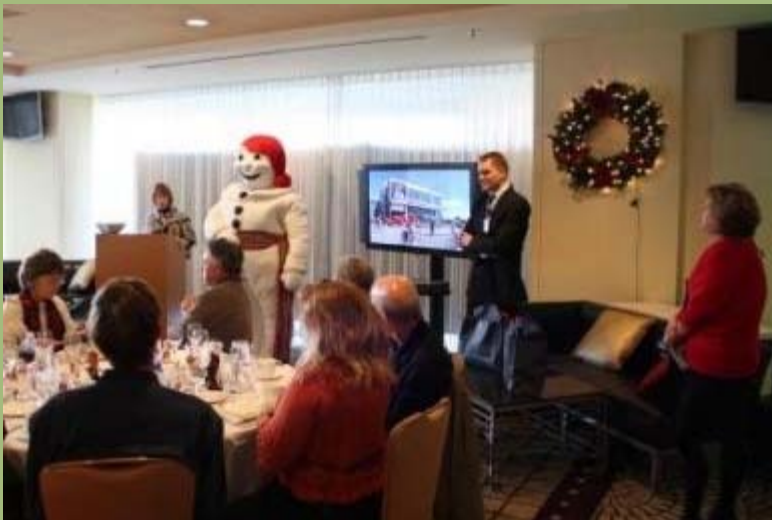
Bonhomme Carnaval a animé les rencontres de presse qui ont eu lieu du 11 au 13 décembre dernier à San Francisco.

Il ne fait pas de doute que les reportages que publieront les journalistes rencontrés sauront intéresser leurs lecteurs à choisir le Québec comme destination de vacances.