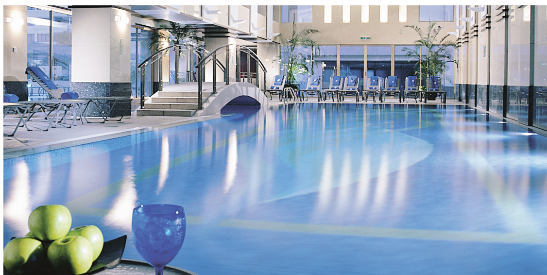
La piscine du Ritz-Carlton Shanghai Pudong affiche bien l'opulence feutrée de la capitale économique de la Chine. À droite: l'aéroport international de Shanghai, ultramoderne et fonctionnel.

Renseignements: Nadine Droulans, Tourisme Wallonie-Bruxelles, à Québec, ☎ 418 692-4939, 1877 792-4939, belgique-tourisme.qc.ca . Notre journaliste était l'invitée d'Air Canada et de Tourisme Wallonie-Bruxelles.