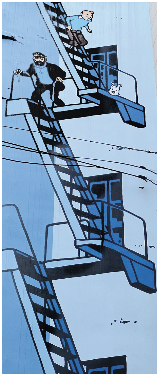
Tintin accompagné du chien Milou et du capitaine Haddock, rue de l'Étuve. À droite: Olivier Rameau et sa compagne Colombe Tiredaille, au pays de Réverose, une série imaginée en 1968 par le scénariste Greg et le dessinateur Dany.