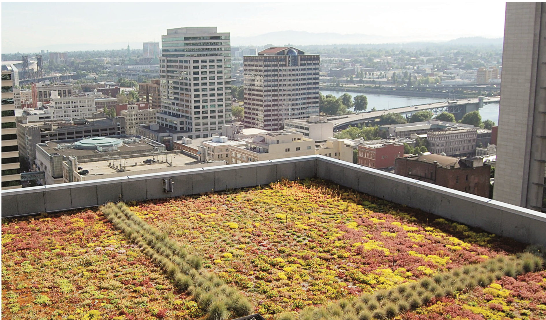
VILLE DE PORTLAND

Depuis 2008, à Portland, dans l'Ouest américain, 50 millions ont été investis et 15 hectares de toits verts et de jardins sur les toits ont été aménagés. Le paysage de la ville en a été transformé.