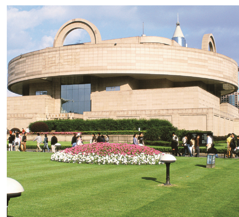
CHINA NATIONAL TOURISM ORGANIZATION

Les salaires augmentent de près de 8% par année et bientôt Shanghai n'aura