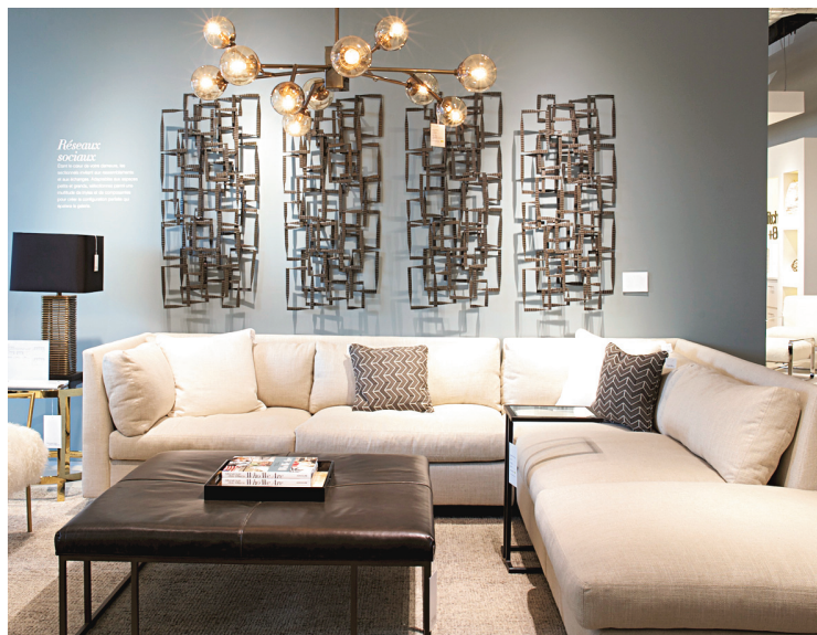
LEONA MOZES MG + BW

C'est un virage à 180 degrés qu'ils ont eu l'audace de faire vivre à l'honorable maison, tous deux convaincus que le temps