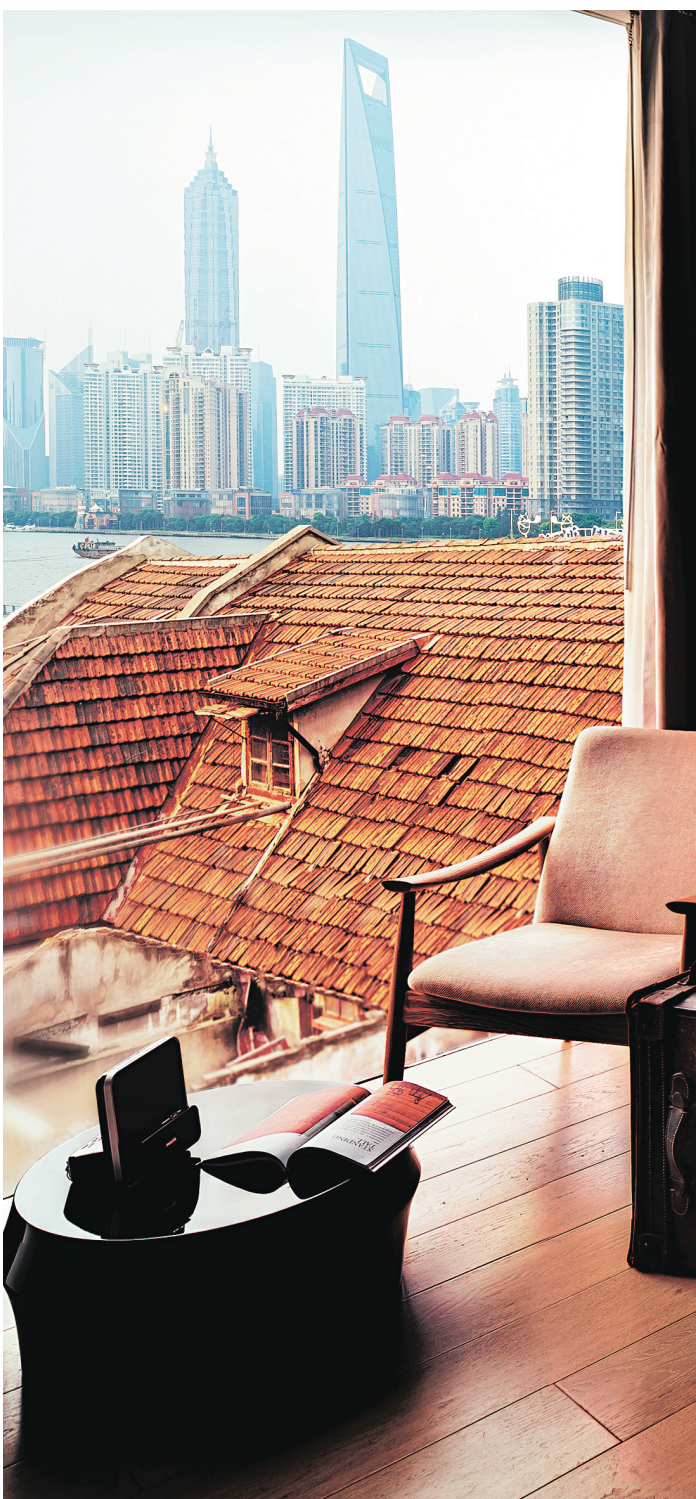
CHINA NATIONAL TOURISM ORGANIZATION

Sous le ciel souvent orageux de Shanghai, les lumières de Pudong percent la grisaille du crépuscule.