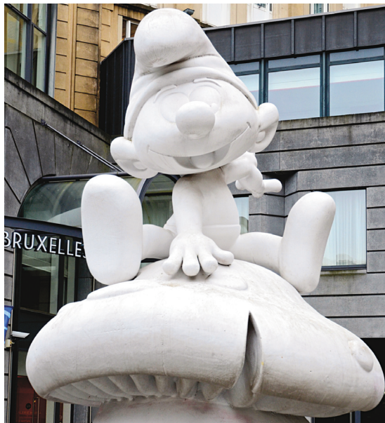
La statue Schtroumpf chevauchant un champignon, rue du Marchéaux-Herbes à Bruxelles.

On peut aussi décider de commencer le parcours au numéro 10, ou à un autre, en fonction du temps et de l'intérêt de l'enfant. Ou ne parcourir