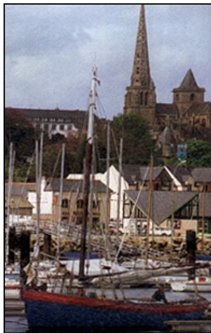
Tréguier en Côtes d'Armor, évêché du Trégor

Chaque année en mai, la cathédrale de Tréguier devient le lieu de rassemblement des fidèles bien entendu, mais également des notaires, des avocats et de tous les juristes qui en ont fait leur saint-patron.