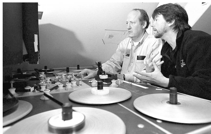
Le producteur Dayton Duncan et le réalisateur Ken Burns, pendant une séance de montage de Jazz.