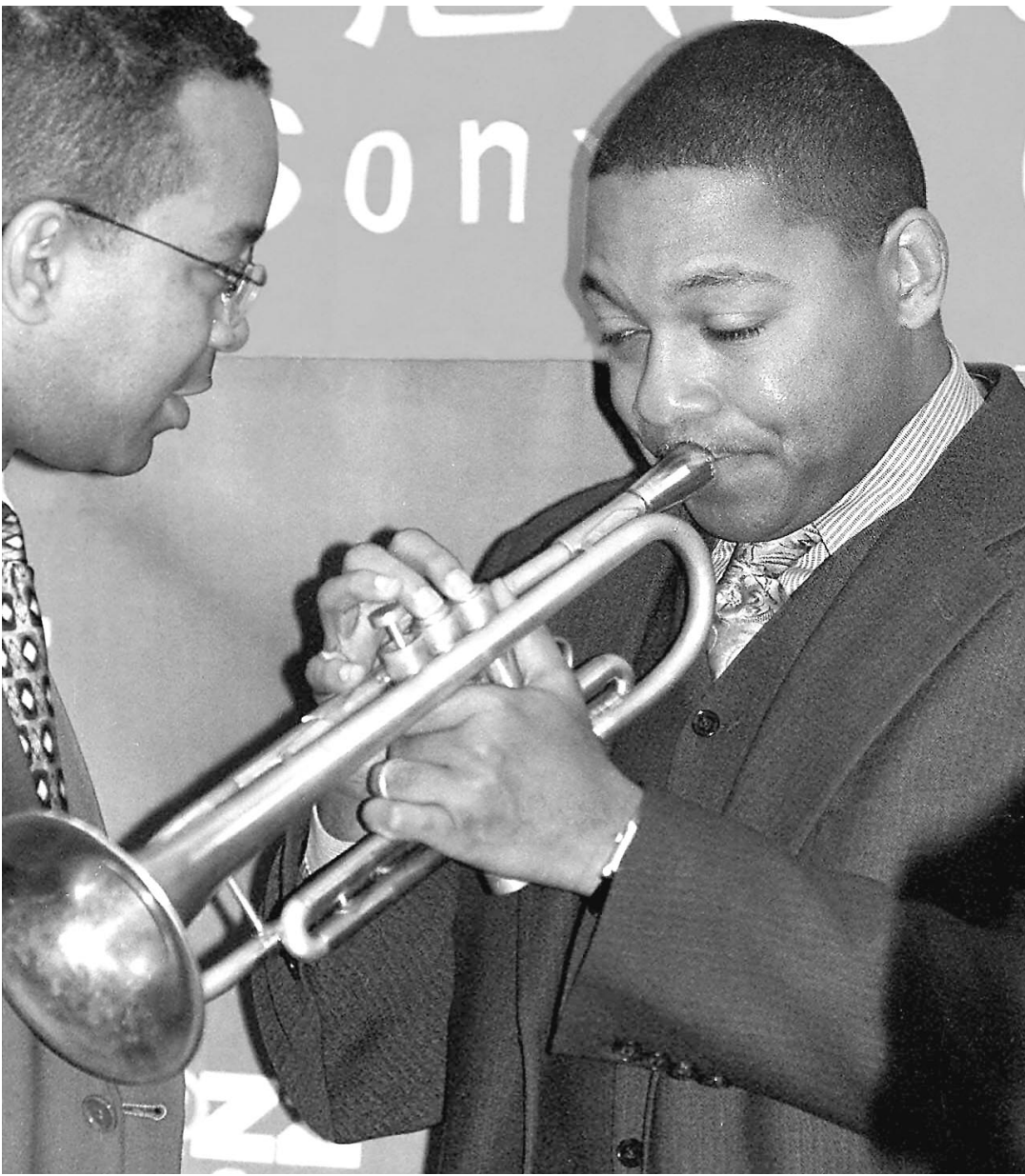
Le trompettiste Wynton Marsalis et sa vision centralisatrice du jazz ont été omniprésents tout au long des 19 heures que durait la série de Ken Burns.

À partir des années 40, c'est-à-dire lorsque le jazz est devenu une forme d'art exigeante au même titre que l'est la musique classique, la liste des omissions s'est allongée. Des pro-