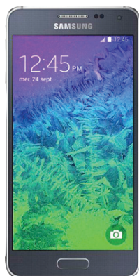
Samsung Galaxy Alpha MC