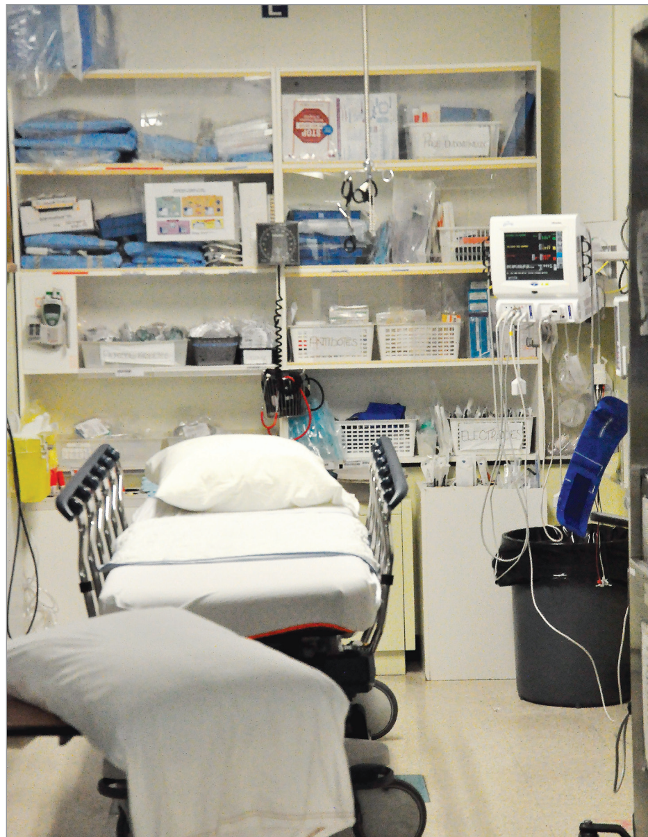
Selon le CSSS, il ne faut pas s'inquiéter du nombre d'incidents dans l'ensemble de l'organisation.

Afin d'aider le CSSS et l'hôpital, madame Sinnett demande la participation de la population. Des sondages téléphoniques auront bientôt, et ceux-ci sont le meilleur indicateur du fonctionnement de l'établissement. Si vous avez quelque chose à dire, ce sera le temps !