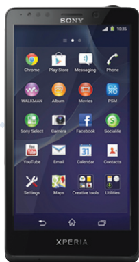
Sony Xperia ® Z2