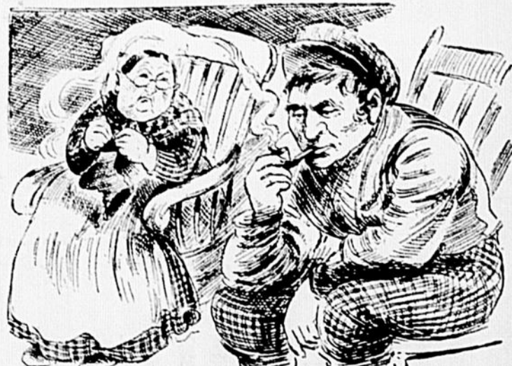
ZOE: — J'espère que tu vas voter pour Giroux. BAPTISTE: — P'te cré, sa mère, c'est l'meilleur.