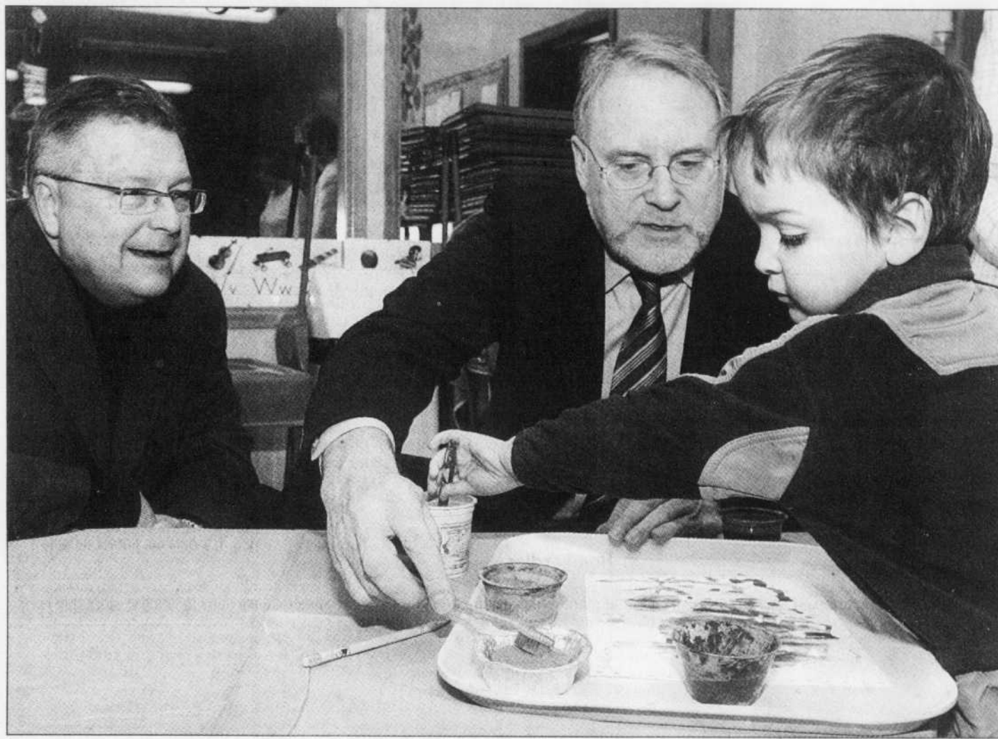
Ken Dryden, ministre fédéral du Développement social dans une garderie de Halifax en mars dernier en compagnie du ministre des Finances, Ralph Goodale, à gauche sur la photo.

Coûts du système de services de garde pancanadien