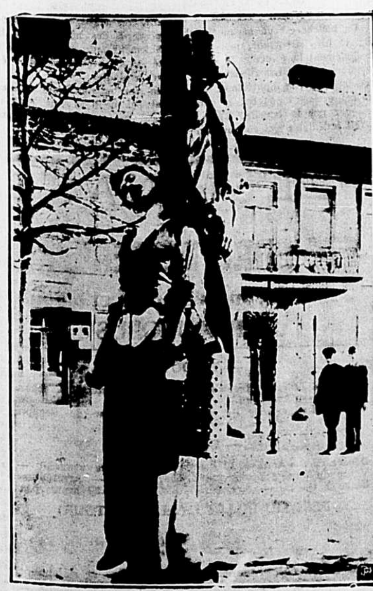
Scène de la vie... ou plutôt de la mort, dans un pays occupé par les Allemands. Il s'agit ici de la Pologne. De pareilles horreurs pourraient bien se produire au Canada si nous ne prétons pas main-forte à nos Alliés. Il nous faut envoyer des combattants outre-mer, sur notre première ligne de défense. Allons au-devant de l'ennemi, n'attendons pas qu'il vienne ici! Soixante mille jeunes Canadiens ont répondu à cet appel au cours des deux derniers mois. — Visé par la Censure.