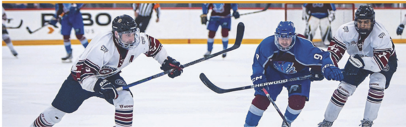
Le Dynamik Service agricole de Coaticook a éliminé les Cobras de Princeville en cinq rencontres.

Elle souhaite reprendre la route l'été prochain. « L'an dernier, j'étais pas mal occupée avec la construction de ma nouvelle maison et ma grossesse. Je n'ai pas pu en profiter autant que je ne l'aurais voulu. Là, j'aimerais me reprendre et faire du motocross et peut-être quelques courses d'endurance », conclut-elle.