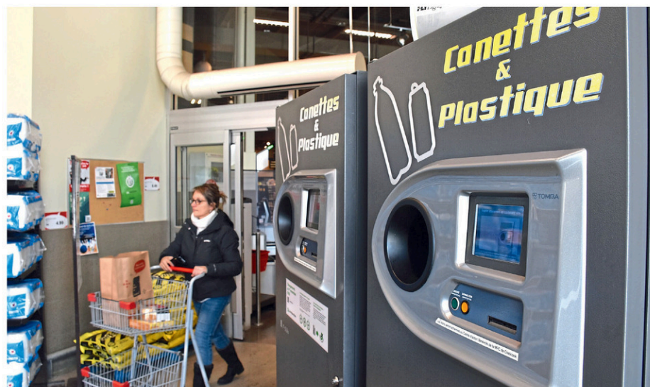
Les machines dites « gobeuses » seront probablement prises d'assaut dès le 1 er mars prochain, date à laquelle la consigne sera élargie.

Le bail a été signé et l'Association québécoise de récupération des contenants de boissons prévoit son ouverture « quelque part au printemps ». « J'ai très hâte que ça ouvre. Ça va définitivement nous aider. Ce sera aussi des équipements dernier cri. »