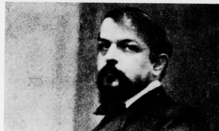
Au programme du "Concert du mercredi", le 17 février à 8 heures, "L'île joyeuse" de Debussy.