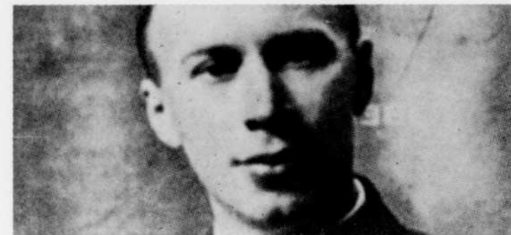
Les Concertos no 3 et no 5 de Prokofiev sont au programme de "Musique du XXe siècle", le samedi 13 février à 6 h. 17.