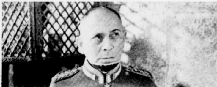
"La Grande Illusion" met en vedette Jean Gabin, Pierre Fresnay et Eric von Stroheim. Ce film sera présenté au "Festival Jean Renoir", le mardi 16 février à 11 heures du soir.

"Le Mouton à cinq pattes", comédie, avec Fernandel.