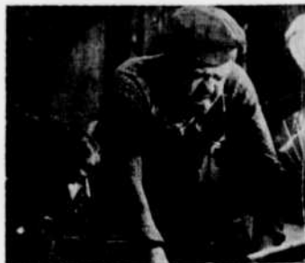
"L'Atalante", drame poétique de Jean Vigo, sera présentée à "Images en tête", le samedi 13 février à 4 h. 30.