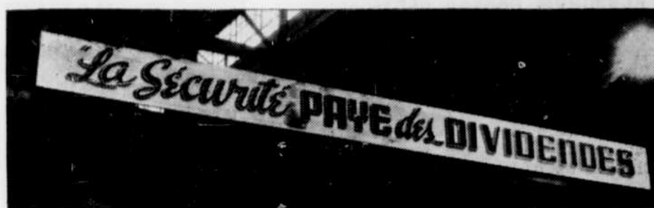
Chronique préparée sous la direction de M. Ls-de-G. Mousseau, surveillant du département de la Sécurité