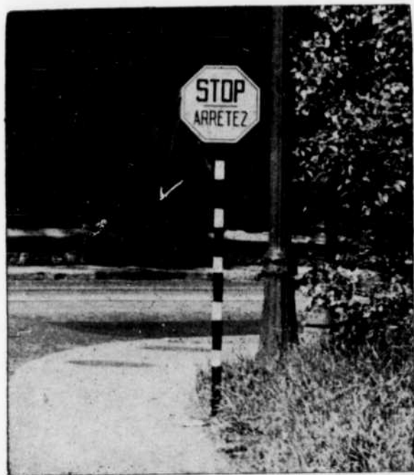
Le signal "Arrêtez" en aluminium