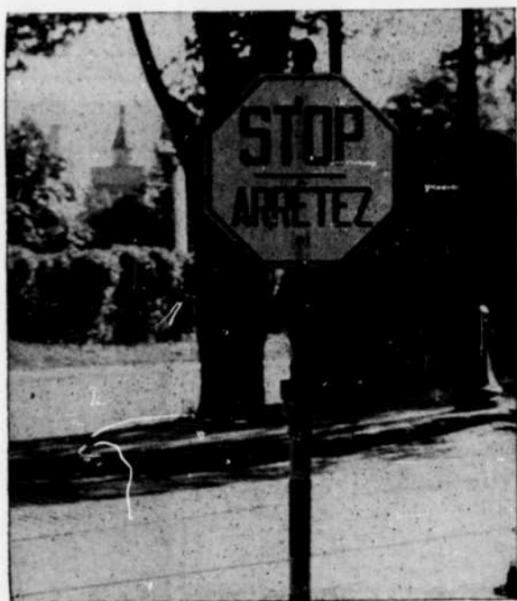
Le signal "Arrêtez" en acier

Les autorités de la Cité de Montréal ont engagé une campagne de plus d'un an en vue de diminuer autant que possible les accidents de la circulation. Dans ce but, les autorités de la cité ont placé au coin des rues Côte-des-Neiges et des Cèdres un signal "Arrêtez" dans lequel on a remplacé l'acier ordinairement employé, par de l'aluminium. Une des caractéristiques de ce nouveau signal est, qu'au lieu que le mot avertisseur "Arrêtez" soit émaillé sur l'acier, le Herald Press Limité l'a tout simplement imprimé directement sur la feuille d'alliage d'aluminium. Bien que ce ne soit encore qu'à l'état d'expérience, il semble que déjà des résultats tangibles aient été obtenus. La visibilité du signal en aluminium est sensiblement supérieure à celui du signal ordinaire sur acier et il a démontré cette supériorité surtout le soir quand la visibilité est tellement importante pour la circulation. Exposés pendant 24 heures aux intempéries de la température, et ce durant les quatre saisons de l'année, les qualités si bien connues de l'aluminium pour sa résistance à la corrosion se sont révélées une garantie que ces signaux dureront et assureront longtemps une protection aux citoyens de cette cité.