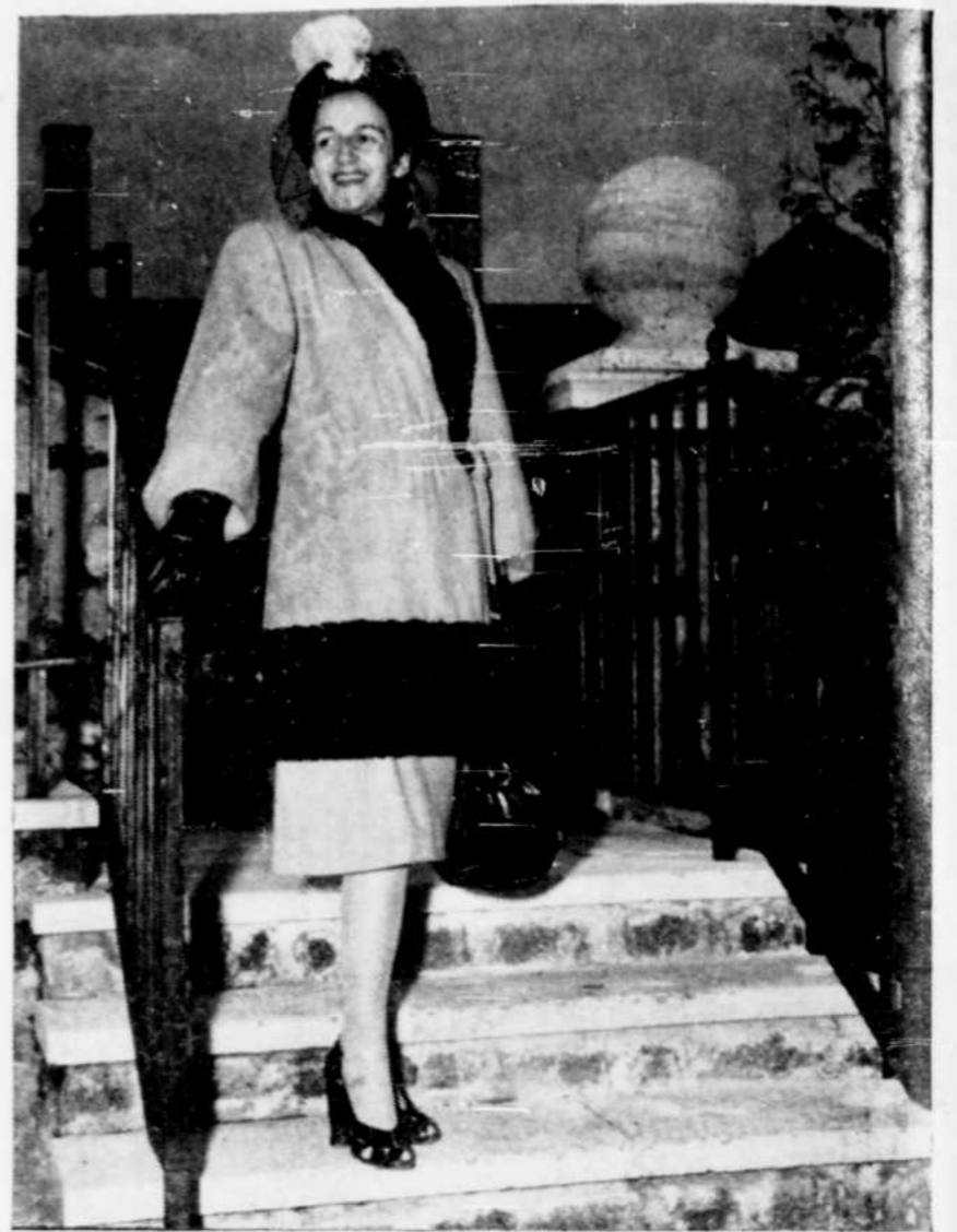
Cet ensemble deux pièces de coupe particulièrement étudiée et élégante a été réalisé en flocet jaune garni de mouton de perse noir. La coquette orne le corsage ample, d'immenses manches ballons. On peut se procurer ce modèle ainsi que d'autres dans toutes les teintes pastel chez J.-G. Boivin, 131, rue Racine, Chicoutimi, voisin de "Chez Roméo".