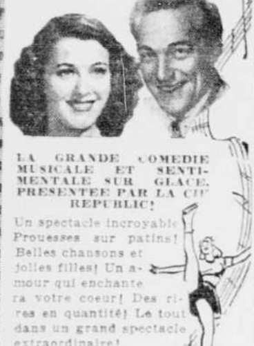
LA GRANDE COMEDIE MUSICALE ET SENTIMENTALE SUR GLACE PRESENTEE PAR LA CHL

Le plus fameux groupe de talentueux patineurs et patineuses jamais vu dans un film!