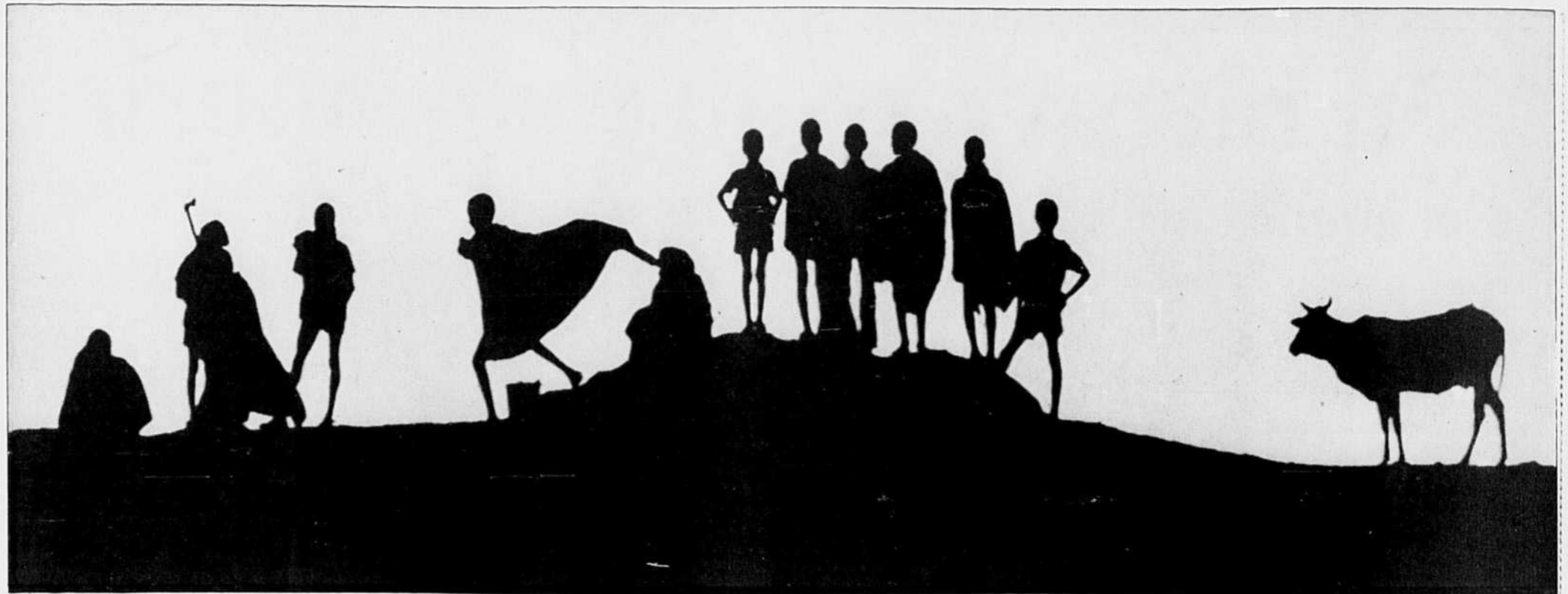
Au soleil couchant, un groupe d'Éthiopiens se prépare à la marche de nuit fuyant la famine vers le Soudan.

Dans la corne de l'Afrique, on assiste à un dramatique mouvement tournant de réfugiés : près de 400 000 Soudanais du Sud et autant de Somaliens en Éthiopie ; plus de 800 000 Éthiopiens de l'Ogaden en Somalie ; enfin plus de 30 000 Somaliens et environ 1500 Éthiopiens à Djibouti. Fuyant leur patrie dévastée et déchirée, des milliers de Libériens se sont réfugiés dans les pays limitrophes : plus de 80 000 en Guinée, 60 000 en