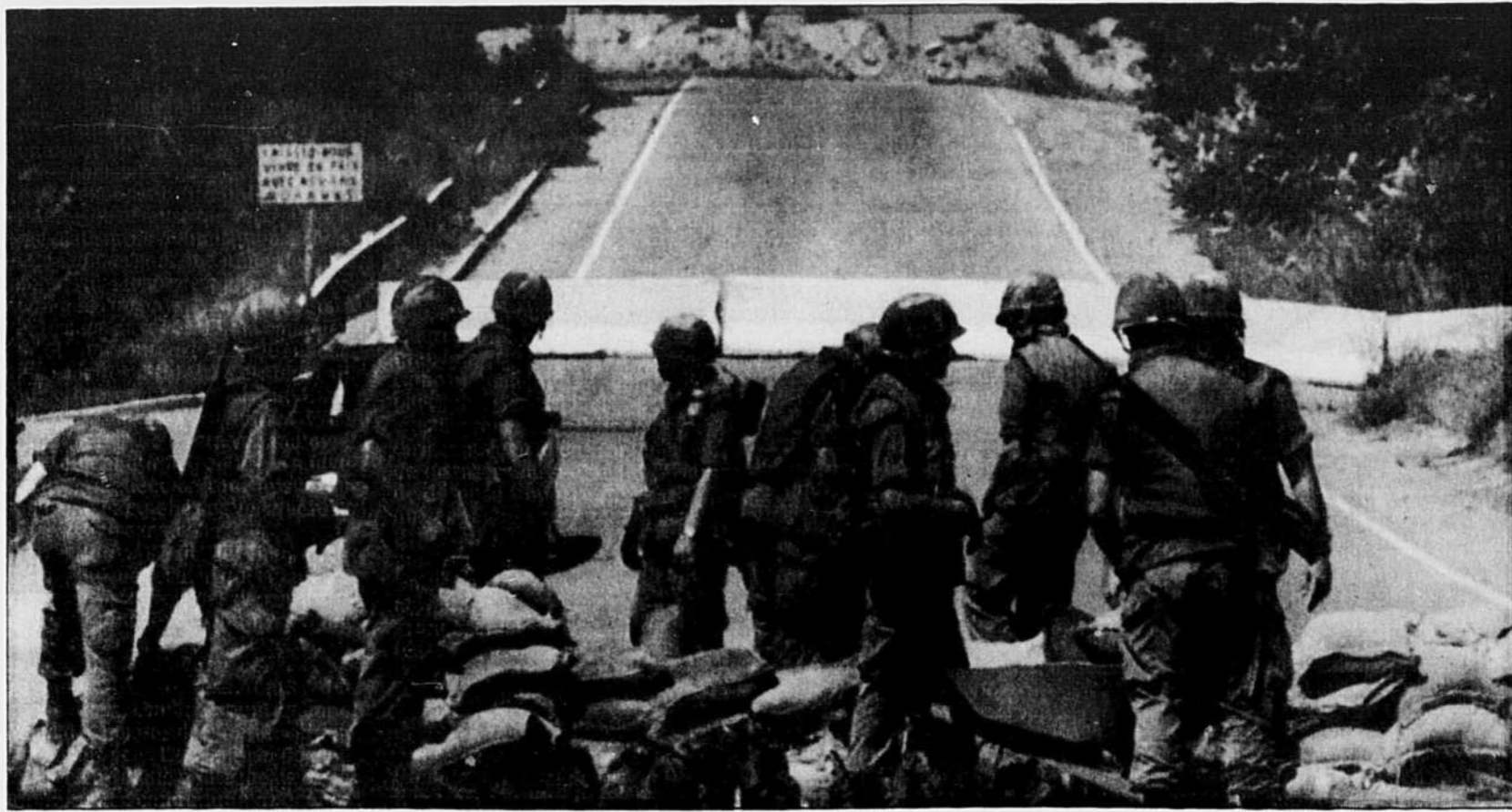
Été 1990, l'armée « québécoise » à Oka. Personne n'a réfléchi sérieusement à ce que serait une véritable armée québécoise.

Devenir adulte, responsable et autonome ou rester enfant, irresponsable et dépendant ? Voilà la véritable question qui décidera de notre propre sort en tant que peuple et en tant que pays.