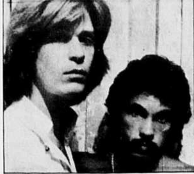
Hall & Oates

ces vieux habitués du Forum que sont Daryl Hall et John Oates, aura clairement démontré qu'à chaque fois que l'on met les pieds dans un aréna de hockey ou dans un stade de baseball pour assister à un concert de rock, sauf exception (Paul Simon au Forum le mois dernier, par exemple), on en ressort défectueux, voire floué. Le postulat tenace selon lequel, faute de place, voir et entendre ses idoles dans des conditions exécrables vaut mieux que de ne pas les voir et les entendre du tout, ne résiste tout simplement pas à une telle soirée. Sur la petite scène du Spectrum, Hall & Oates s'amusaient comme jamais auparavant, visiblement ravis de renouer avec un public qu'ils avaient fini par perdre de vue. Dans la salle, débarrassés des indispensables lunettes d'approche, n'ayant plus à supporter l'inférieure réverbération inhérente aux amphithéâtres sportifs, les fans se félicitaient de leur sort, aussi impressionnés par la proximité du célèbre tandem que par l'ambiance chaleureuse et intime de l'endroit. La musique, forcément, s'en portait à merveille. L'approche acoustique convenait parfaitement au Spectrum et les diverses combinaisons de contrebasse, d'orgue Hammond B-3 (quel son !), de violon, de violoncelle, d'accordéon, de piano, de batterie et de guitares « débranchées » réchauffaient le répertoire d'Hall & Oates de plusieurs degrés, qu'il s'agisse du matériel supérieur des débuts ( Sara Smiles, She's Gone