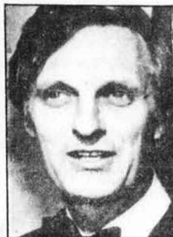
Cher, vêtue à la pirate, signait des autographes hier au sortir de la répétition du gala des Oscars de ce soir. Steven Spielberg, lui, « snobé » par ses pairs, faisait l'objet de toutes les conversations. Quant à Jane Fonda, Robin Williams et Alan Alda, ils sont les maîtres de cérémonie de l'annuelle grand-messe d'Hollywood.

sicales réunissant June Allyson, Leslie Caron, Marge Champion, Cyd Charisse, Kathryn Grayson, Ann Miller, Jane Powell et Esther Williams.