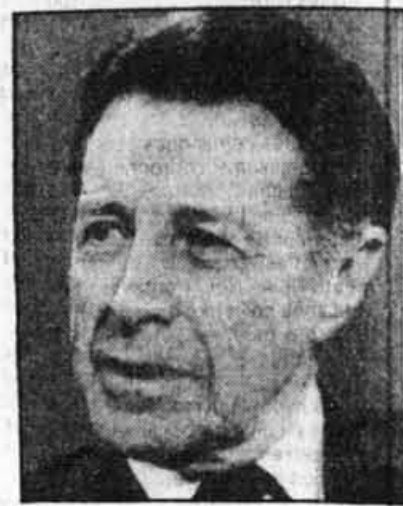
Caspar Weinberger

Pour sa part, le président nicaraguayen Daniel Ortega a lancé samedi un appel pour l'ouverture de négociations de paix avec le président Reagan, dont il a dit qu'il préparait une « vietnamisation » du conflit en Amérique centrale. Ortega a indiqué que, même avec l'aide des conseillers militaires américains, les contras seraient vaincus et Washington serait alors forcé d'envoyer ses soldats, ses hélicoptères et son aviation, « embrasant toute l'Amérique centrale ».