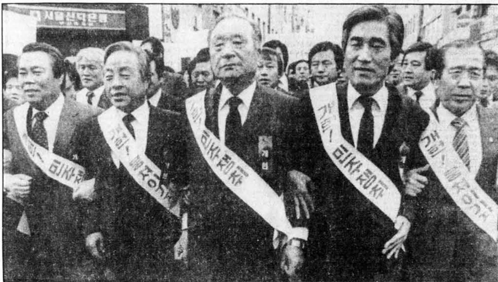
Plus de 20 000 personnes ont défilé hier dans les rues de Pusan, seconde ville de Corée du Sud, pour réclamer la démission du président Chun, avec à leur tête