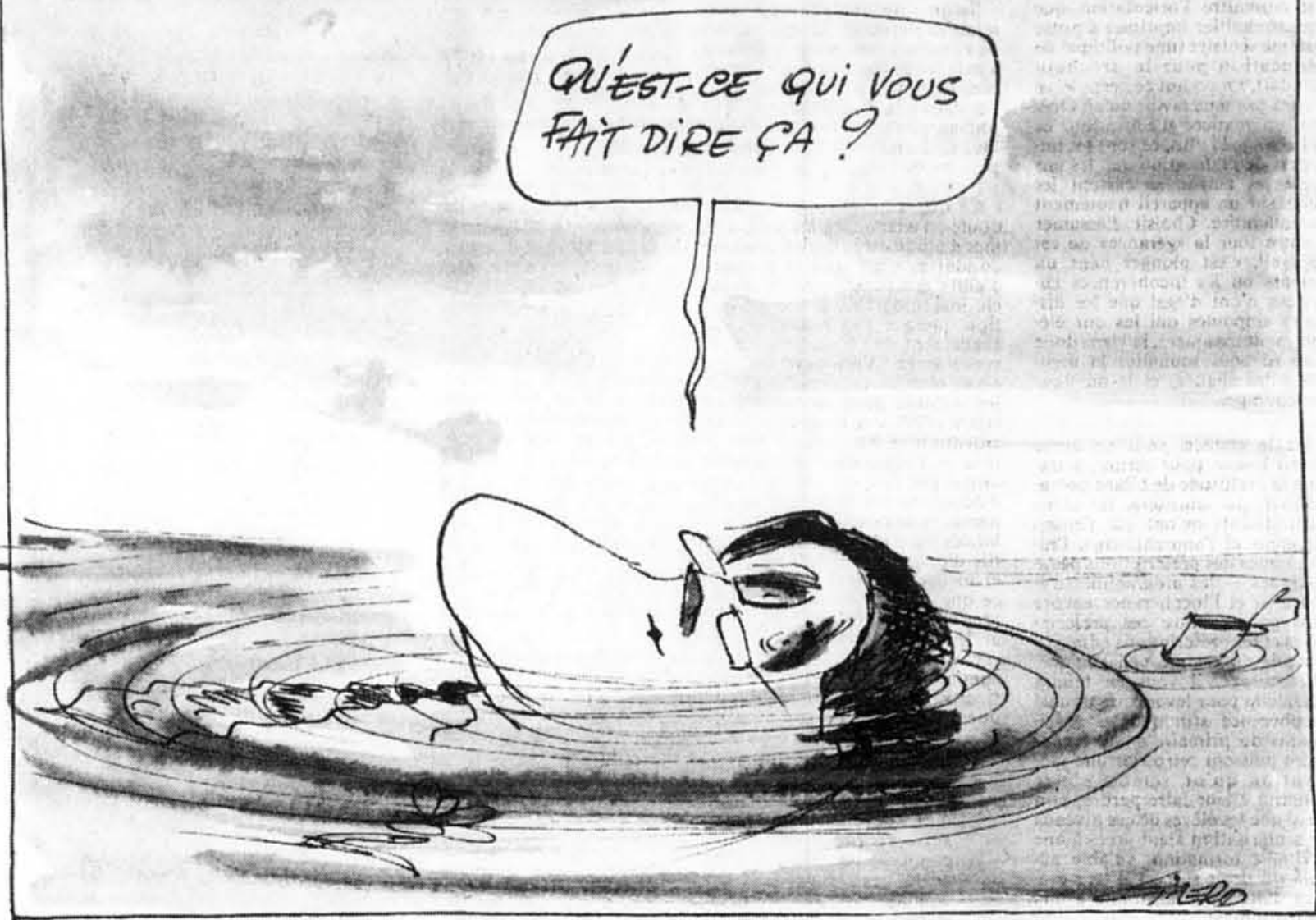
(Tous droits réservés)