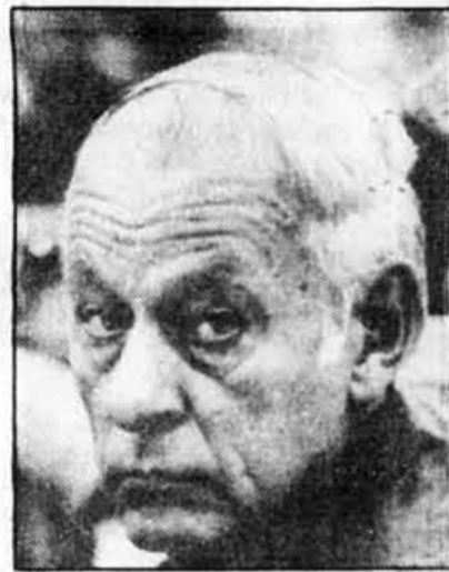
M. René Lévesque

C'est la somme la plus importante versée à un homme politique au Canada mais, de toute évidence,