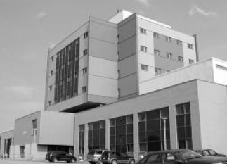
CSSS DE LA HAUTE-GASPÉSIE