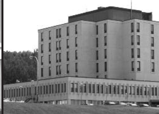
CSSS DE LA CÔTE-DE-GASPÉ