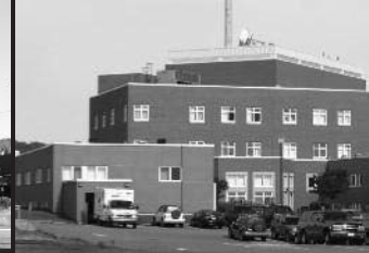
CSSS DES ÎLES