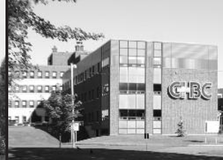
CSSS DE LA BAIE-DES-CHALEURS