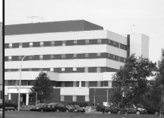
CSSS DU ROCHER-PERCÉ