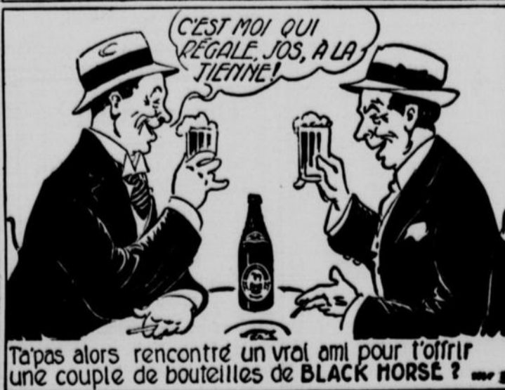
T'a'pas alors rencontré un vrai ami pour t'offrir une couple de bouteilles de BLACK HORSE? —