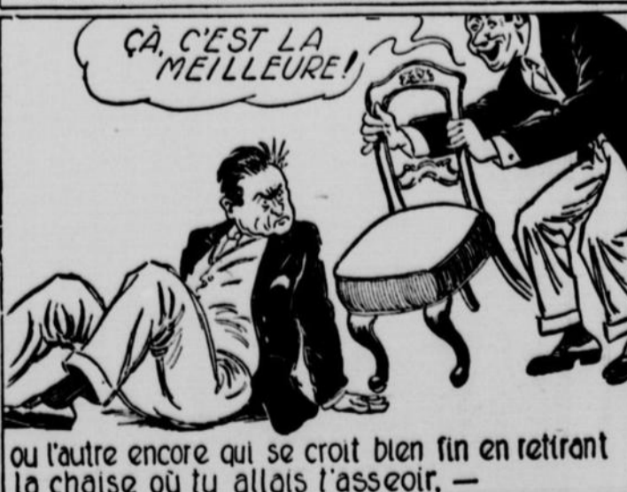
ou l'autre encore qui se croit bien fin en retirant la chaise où tu allais t'asseoir. —