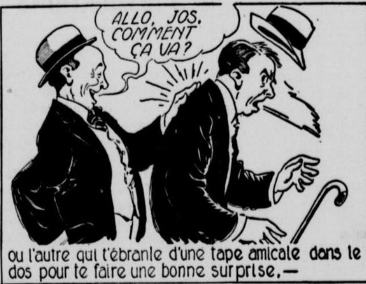
ou l'autre qui t'ébranle d'une tape amicale dans le dos pour te faire une bonne surprise. —