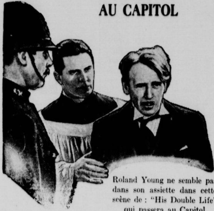
Roland Young ne semble pas dans son assiette dans cette scène de: "His Double Life" qui passera au Capitol demain et samedi, en même temps que "Conquering Sex".