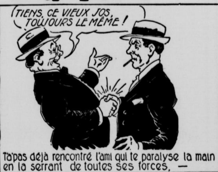
T'a'pas déjà rencontré l'ami qui te paralyse la main en la serrant de toutes ses forces. —