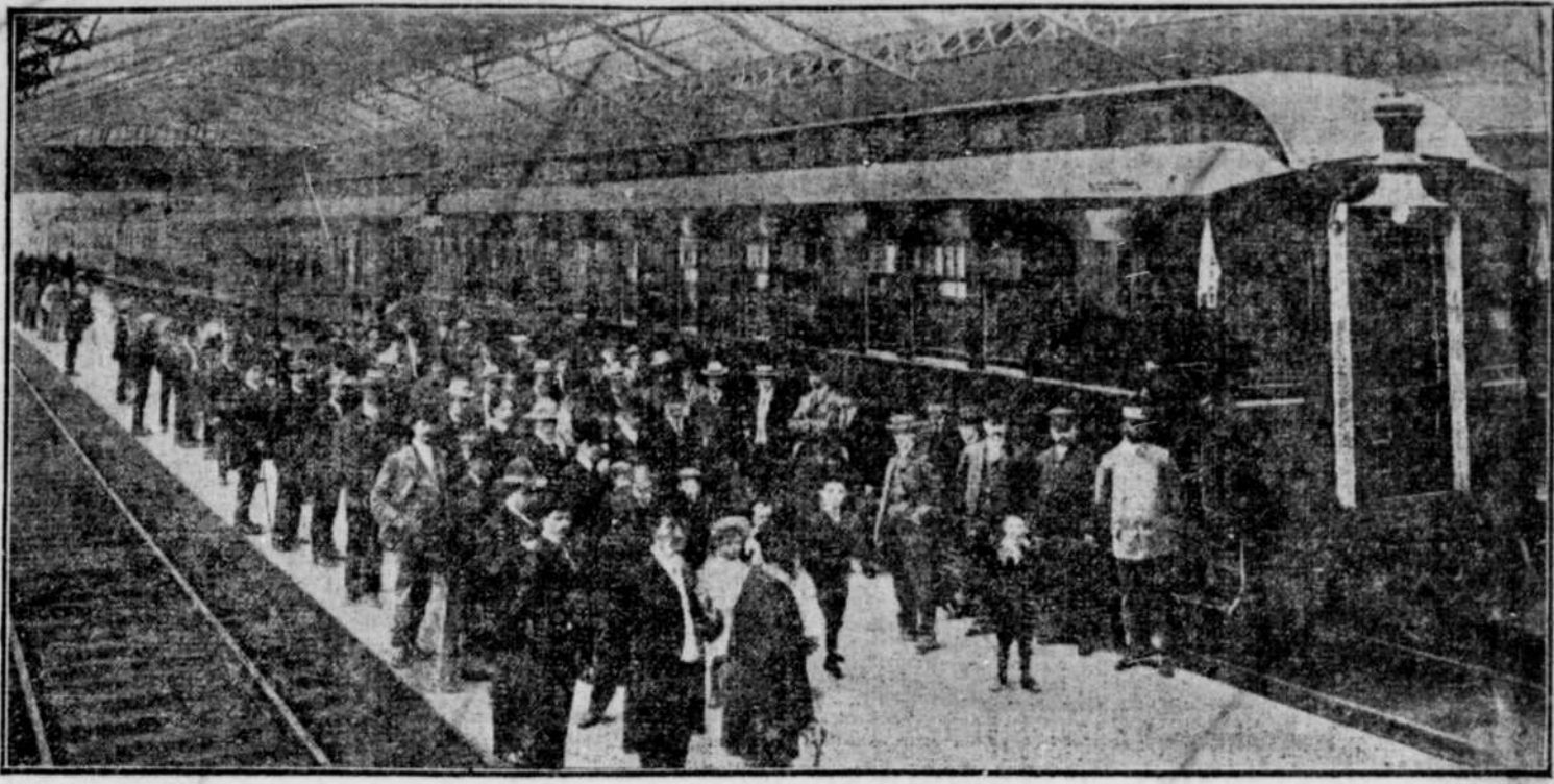
LE TRAIN LUXUEUX "IMPERIAL LIMITED", D'APRES UNE PHOTOGRAPHIE PRISE A LA GARE WINDSOR, HIER, AVANT SON DEPART POUR L'OUEST

Son premier voyage de la saison à Vancouver.