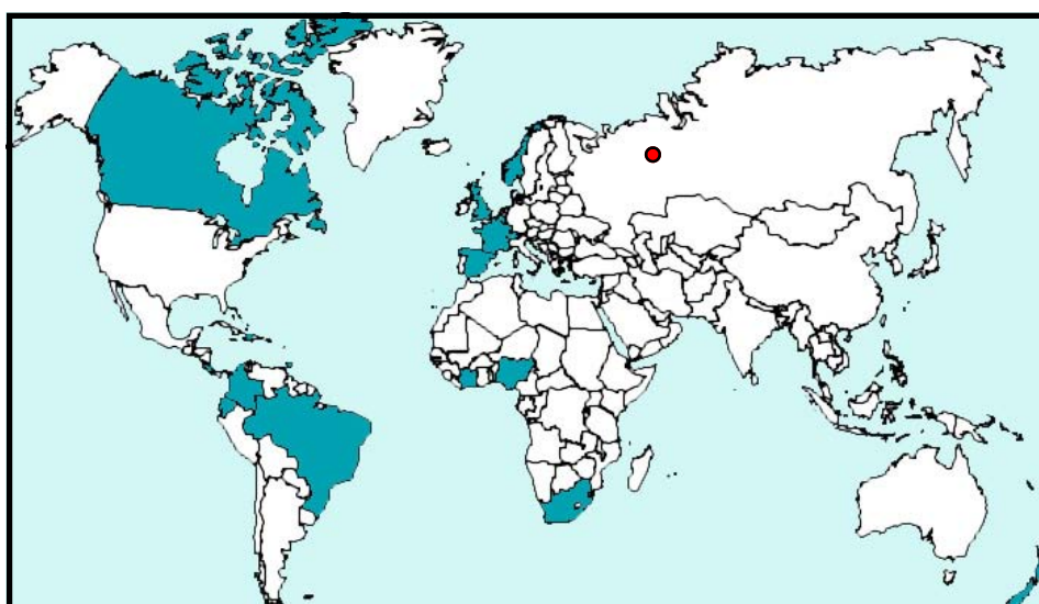
Pays ayant pris part à la première rencontre internationale sur les

La 1 ère Rencontre internationale sur les Observatoires de la criminalité , organisée en coopération avec l'Observatoire national de la délinquance et la Délégation interministérielle à la ville de France, à Paris, les 11 et 12 décembre 2007, a réuni une trentaine d'intervenants en provenance de tous les continents et près de 200 participants de 25 pays différents. Les débats ont été organisés autour des