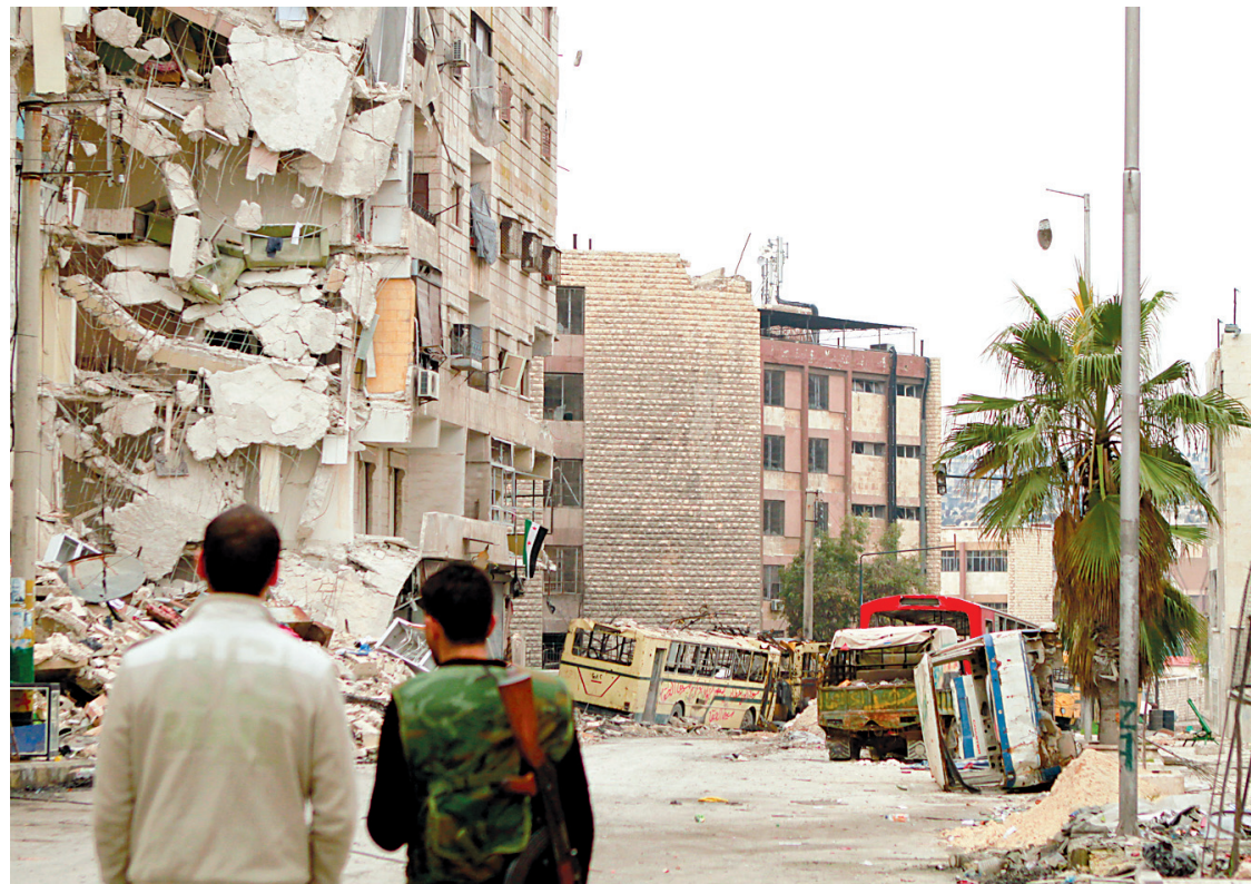
Des rebelles syriens constatent les dégâts dans une banlieue d'Alep.

De plus, un bilan provisoire de l'Observatoire syrien des droits de l'homme recense 127 morts pour la seule journée de mercredi. Parmi eux, 60 civils et une vingtaine de rebelles tués dans la foulée des attaques contre les aéroports militaires au nord du pays et la