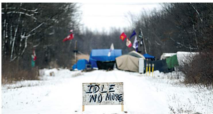
Il y a maintenant 13 jours que des manifestants autochtones ont bloqué la voie ferrée du CN à Sarnia, en Ontario, dans le cadre du mouvement Idle No More.