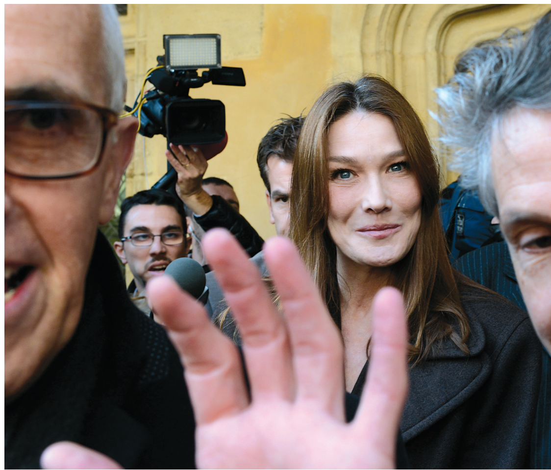
Carla Bruni-Sarkozy, qu'elle le veuille ou non, est une femme publique. Elle n'est pas une nobody, elle est une star.