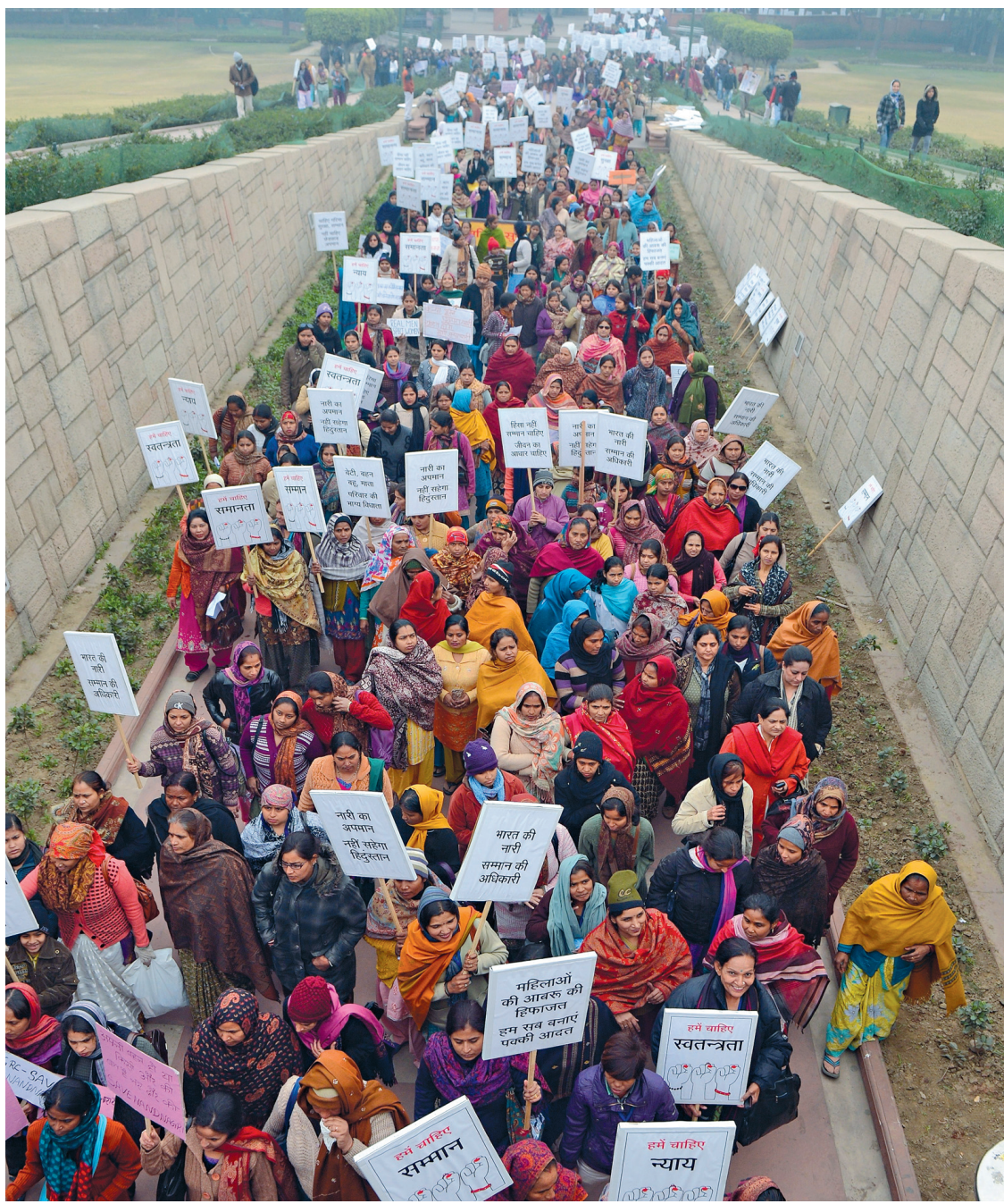
Marche de la «dignité des femmes» mercredi à New Delhi