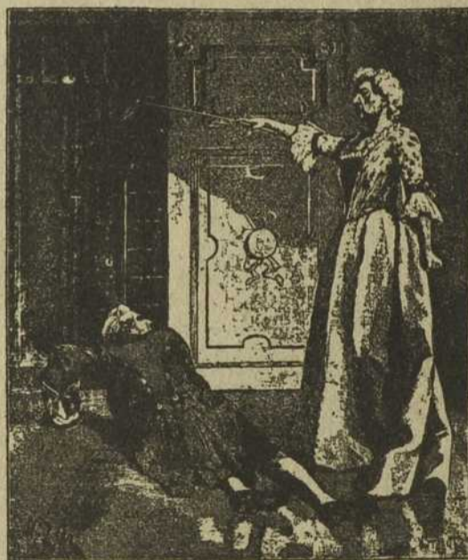
Et l'homme terrassé, tout contondant, se traîne péniblement vers la cage, page 8, col. 3

Contient les plus beaux ro- mans du jour ; magnifiques illus- trations. Huit pages UN SOU