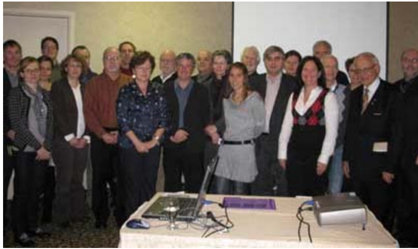
La première cohorte de médecins omnipraticiens de la région à participer au programme de Formation en gériatrie.

Les résultats d'appréciation des deux premières journées sont excellents. La formule ainsi que le contenu du programme correspondent aux attentes des participants, ce qui est très apprécié du comité scientifique, qui adapte et souhaite se rapprocher le plus possible de la réalité de leur pratique.