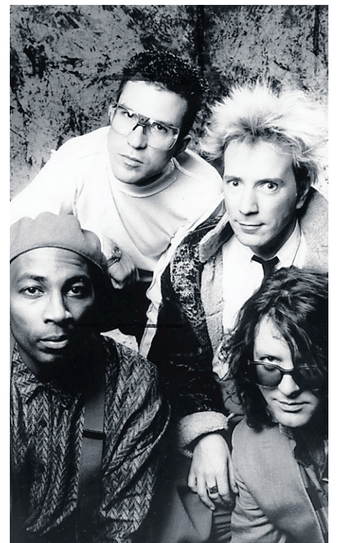
Public Image Limited

— Philippe Renaud, collaboration spéciale