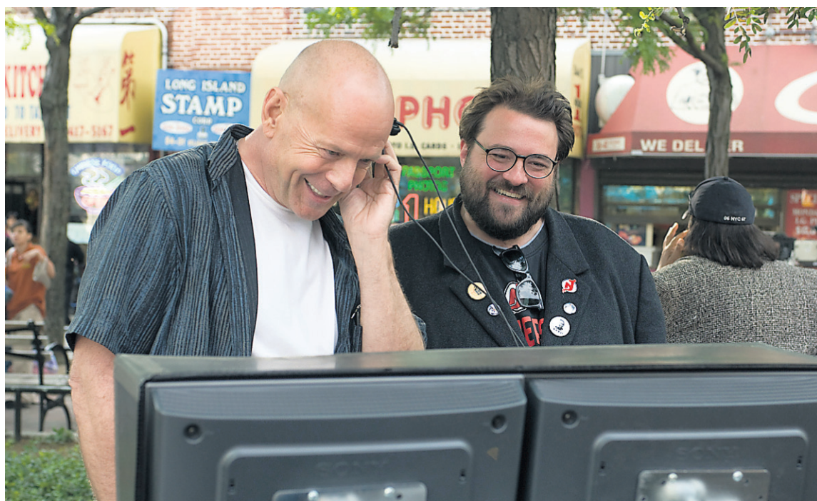
Bruce Willis et le réalisateur Kevin Smith.

« Cette série m'a donné la chance de travailler avec Tina et Alec (Baldwin), une expérience qui m'a aidé à être un peu plus relax quand je me suis retrouvé devant Bruce » lors du tournage de ce film où « nous avons cherché