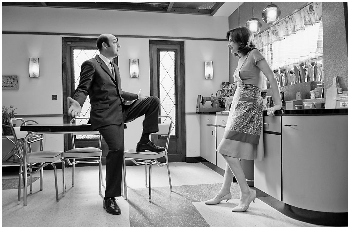
Une scène du film Le Petit Nicolas qui a remis l'œuvre de Sempé et de Goscinny au goût du jour.

Tout commence en 1955. Jean-Jacques Sempé fait alors des dessins pour l'hebdomadaire belge Le Moustique . L'un d'entre eux, un petit garçon en culottes courtes, revient assez fréquemment pour que le rédacteur en chef lui demande de lui trouver un nom. Dans l'autobus, Sempé, alors âgé de 23 ans, voit une annonce du négociant en vins Nicolas et décide d'emprunter le nom, confiait-il en 2007 au magazine littéraire Lire .