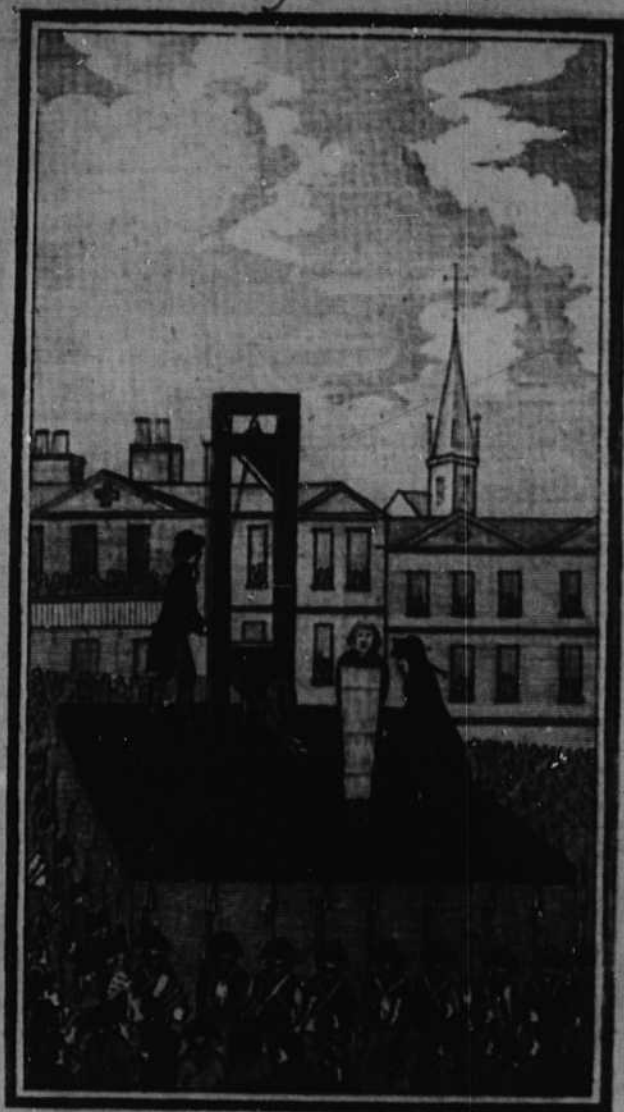
DEATH of LOUIS XVI.