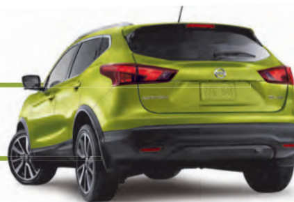
Qashqai SL Platine illustré*

HÂTEZ-VOUS! NOS 2017 PARTENT VITE, VRAIMENT VITE!