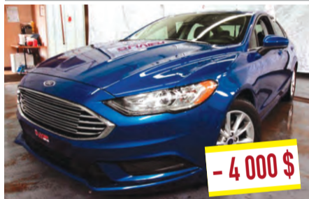
FORD FUSION SE 2017