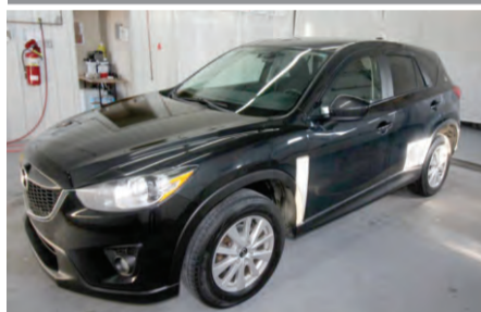
MAZDA CX-5 GX 2013