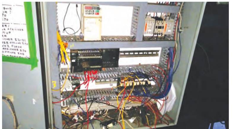
Des équipements du Phare ont été vandalisés.

Du côté de la Sûreté du Québec, on refuse de confirmer que des suspects ont été identifiés dans cette affaire. Le Phare assure que les dommages infligés ne compromettent pas les activités de tri des matières recyclables de l'entreprise.