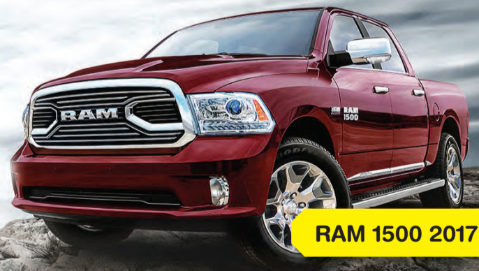
RAM 1500 2017

VOUS REBÂTISSEZ VOTRE HISTORIQUE DE CRÉDIT ?