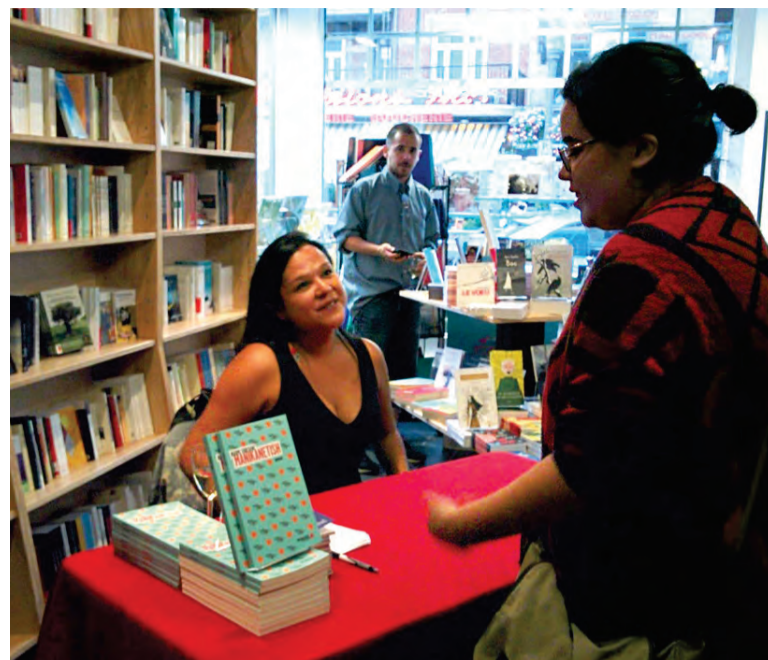
Dès que l'occasion se présentera, l'auteure nord-côtière entend bien revenir à Uashat pour y lancer son roman.

Avant tout, elle espère faire en sorte que le regard négatif qu'elle estime porté sur plusieurs de ces jeunes cesse. «Je l'ai surtout écrit pour mes élèves. Ces jeunes en finissent par croire que leur vie est une suite d'échec. J'ai voulu leur dire que ce n'est pas le cas et qu'ils ne doivent pas assimiler ce discours qui est véhiculé dans les