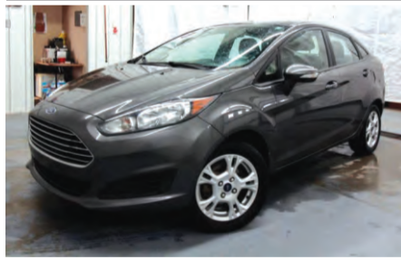
FORD FIESTA SE 2015