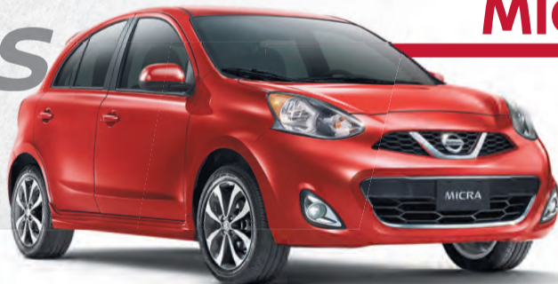
Micra SR illustrée*

Location à partir de 171 $ par mois, avec 995 $ en comptant initial.