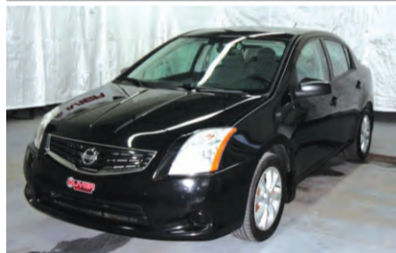
NISSAN SANTRA 2012