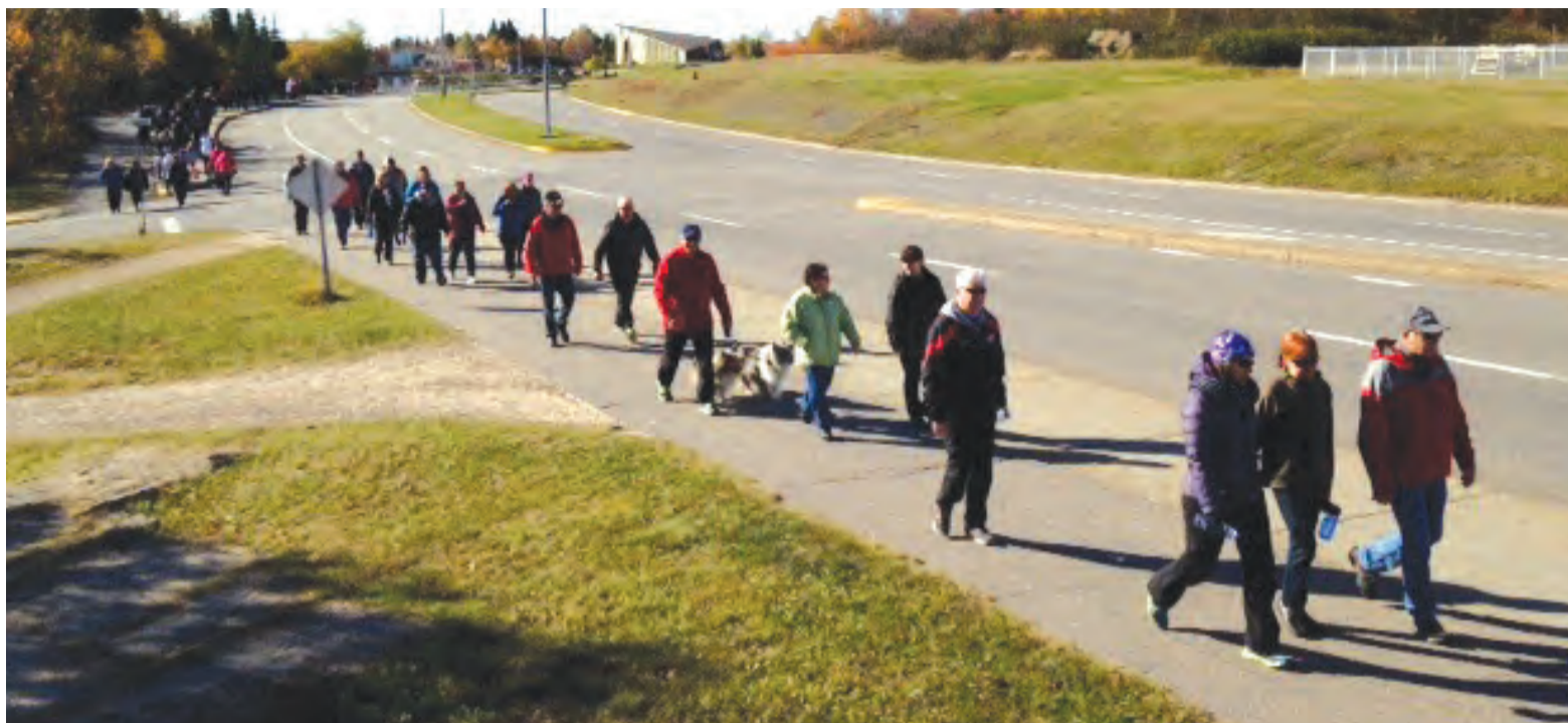
Comme à Port-Cartier l'an passé (et encore cette année), Maliotenam fera partie des communautés participantes à la Grande marche du Grand défi Pierre Lavoie

«J'adore la marche et je veux prendre ma santé en main. Les cubes de marche étaient une belle