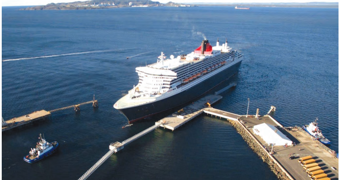
Si certains commerçants tirent des bénéfices de la venue de bateau de croisière, comme le Queen Mary 2, le 2 octobre, d'autres doutent des retombées.