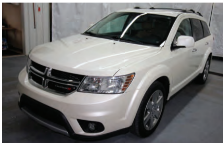
DODGE JOURNEY R/T 2013