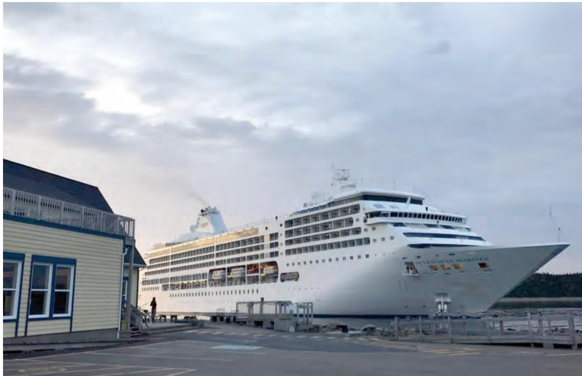
Le navire Artania est le dernier navire de croisière à avoir accosté à Havre-Saint-Pierre en 2018.

Une tradition s'est également créée au fil des ans. En effet, chaque fois qu'un bateau quitte le quai, les Cayens se rassemblent, drapeau acadien à la main, afin de