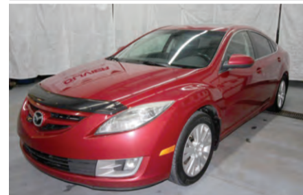
MAZDA 6 GS 2010