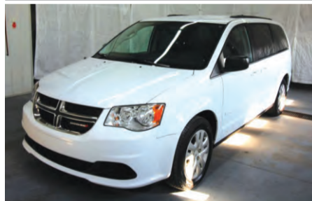
DODGE GRAND CARAVAN SXT 2016