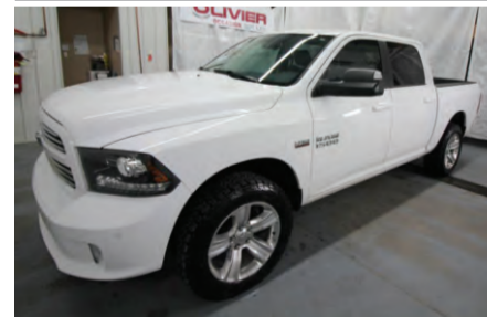
RAM 150 SPORT 2014