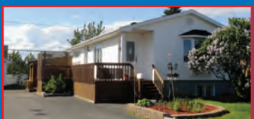
113 LEBLANC / CHRISTIAN TRUCHON