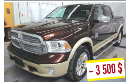
RAM 1500 LONGHORN 2015