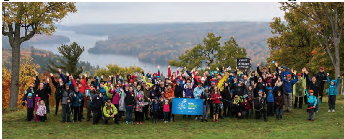
À la fin de cette belle aventure, une photo de groupe sera prise au sommet de la montagne avec le drapeau porte-étendard de Chaîne de vie pour souligner l'accomplissement de ce bel exploit.

Comme il s'agit d'une première expérience, l'organisation ne s'est fixé aucun objectif financier. Rien n'empêche qu'elle espère tout de même réussir à rejoindre une qua-