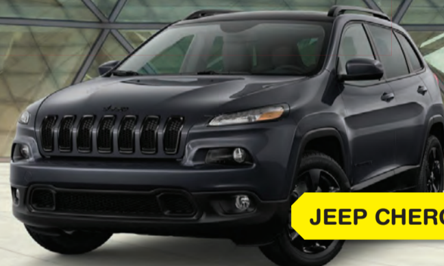
JEEP CHEROKEE 2018