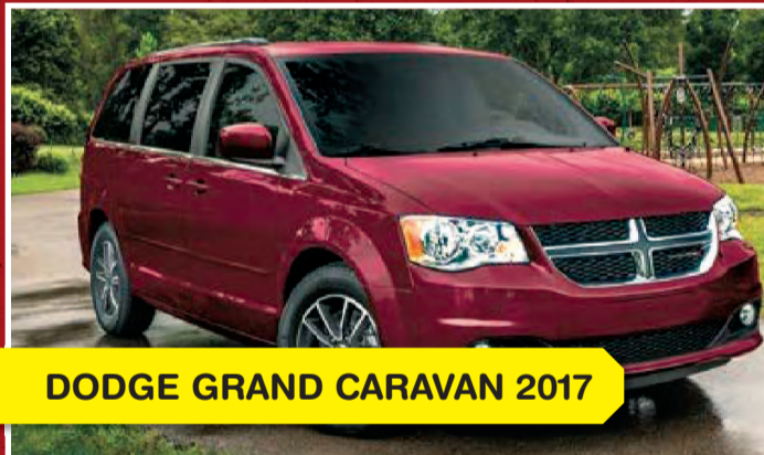
DODGE GRAND CARAVAN 2017