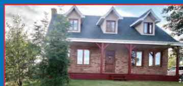
118 CHAMBERS / CAROLINE TRUCHON

VISITE LIBRE DIMANCHE 15 OCTOBRE DE 14H À 16H