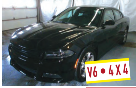
DODGE CHARGER SXT PLUS TI 2016