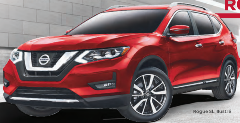
Rogue SL illustré