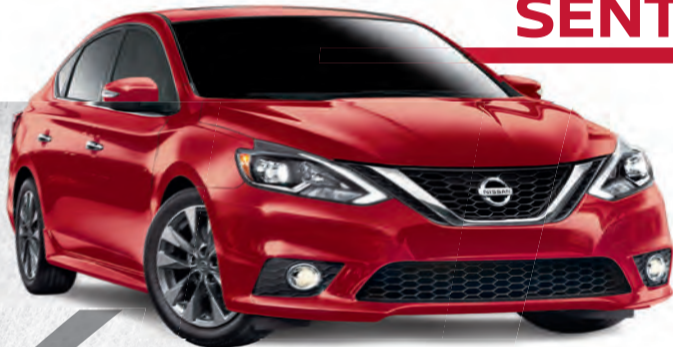
Sentra SR Turbo illustrée*

Location à partir de 214 $ par mois, avec 1 295 $ en comptant initial.