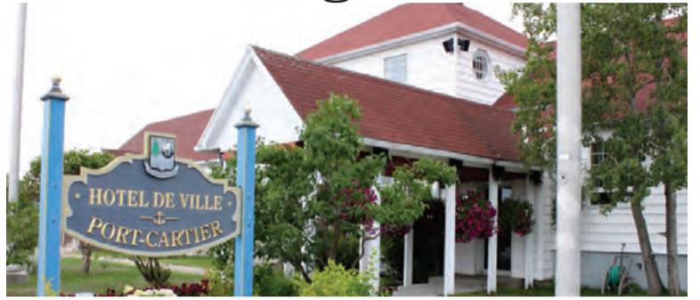
Ville de Port-Cartier.