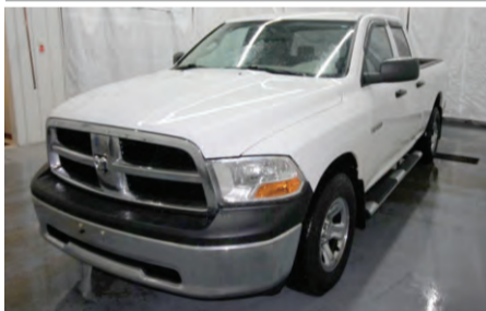
DODGE RAM 1500 ST 2010