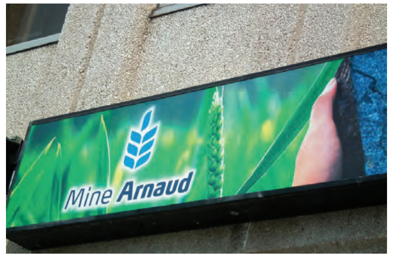
Les Innus de Uashat mak Mani-Utenam décideront de l'avenir du projet Mine Arnaud par référendum.

Une entente répercussions et avantages avec Mine Arnaud permettrait à la communauté innue d'obtenir des contrats, des emplois et des redevances sur les profits de la minière, si le projet démarre, en compensation de l'exploitation de leur territoire traditionnel. «Nous, on revendique un grand territoire. On est capable de prouver qu'on était là bien avant les Européens», explique le vice-chef. Le conseil de bande ne prendra pas position en vue du référen-