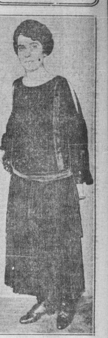
LA PREMIERE FEMME DE SON PAYS: MADAME CALVIN COOLIDGE, femme du nouveau président des Etats-Unis, qui régnera désormais dans le monde social de Washington et du pays en général.