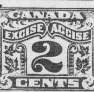
LE NOUVEAU TIMBRE DU DEPARTEMENT DE L'ACCISE DU CANADA EN CIRCULATION DEPUIS LE 1ER AOÛT, IL PORTE UNE INSCRIPTION EN ANGLAIS ET EN FRANÇAIS. Avant le premier août, les timbres de l'accolle ne portaient qu'une inscription anglaise. On sait que cette réforme est due à l'initiative de l'honorable Jacques Bureau, ministre des douanes dans le cabinet King.