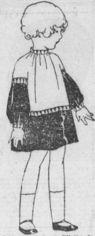
Petite robe pour fillette de 4 ans. Elle est en ratine rose et taffetas marine. Une délicate bordure de sole bleue court sur le bord de la ratine.