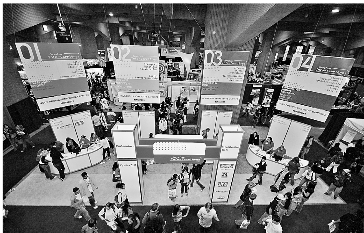
Accueillant plus de 220 exposants et quelque 25 000 visiteurs, les deux salons sont évidemment ouverts au public.

«La première chose que nous avons faite, c'est de scinder l'événement en deux entités distinctes, bien que présentées côte à côte. Ce fut le début de notre nouveau positionnement: un évé-