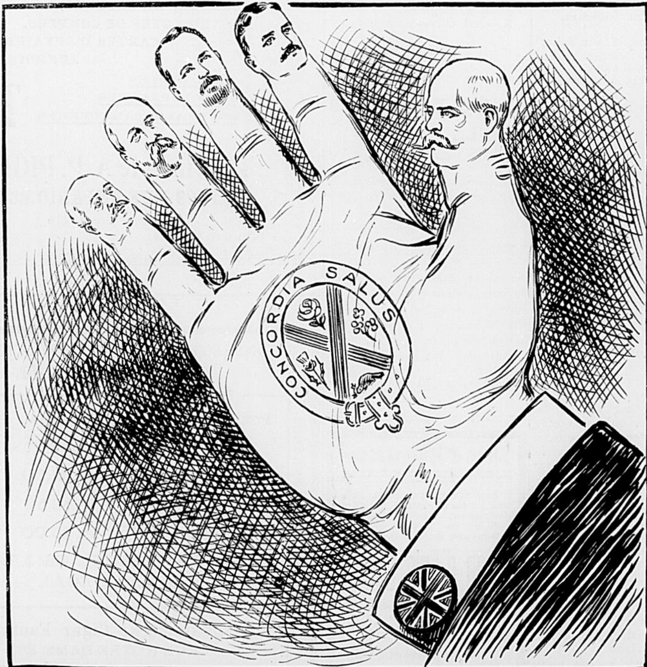
Le "Canard" publie cette semaine une reproduction exacte de la Main municipale. Le pouce est de fabrication irlandaise, et l'index en peau et en os de "canayen". Le médius est de marque aristo, et l'annulaire possède le ciselé capricieux du Westmountois. Quant à l'auriculaire, on l'amputera dans cinq ou six mois.