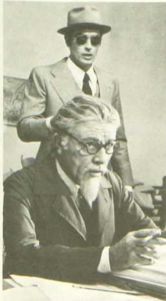
L'Assassinat de Trotsky

Les historiens du cinéma affirment que tout en restant fidèle aux faits, Losey s'est permis une certaine part d'interprétation dans la présentation des mobiles d'action du meurtrier.