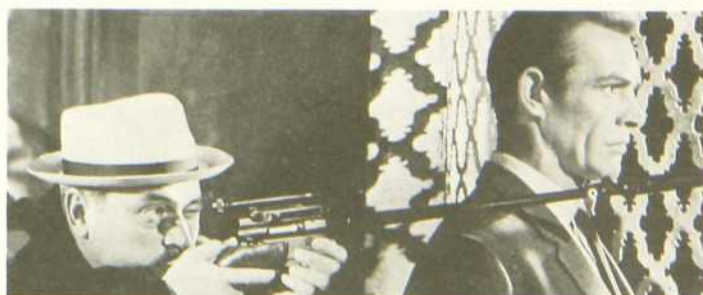
Bons baisers de Russie

Tous les historiens du cinéma ont reconnu que le film de Huston est une production qui tranche par ses ambitions et ses grandes qualités.