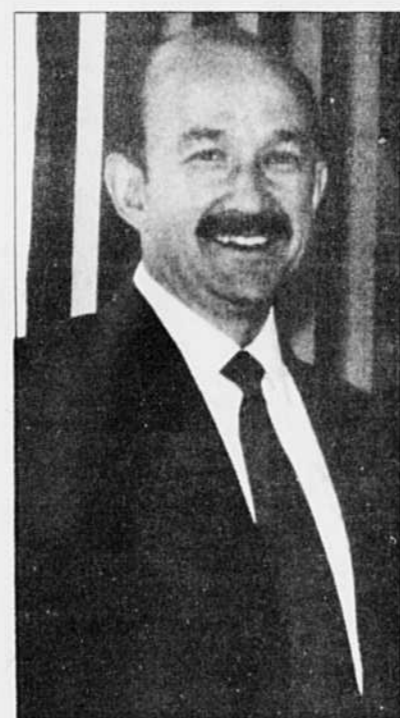
Le président mexicain, Carlos Salinas de Gortari.