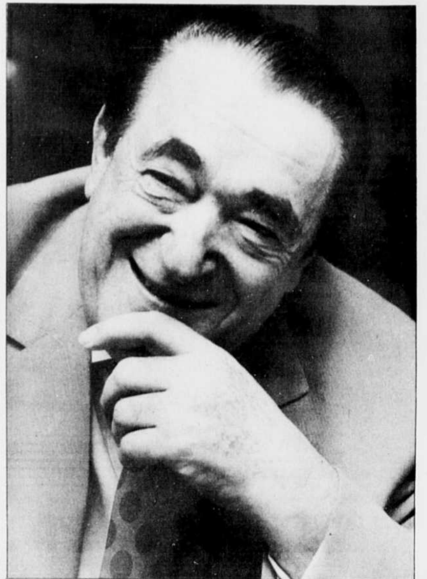
Robert Maxwell 1923-1991