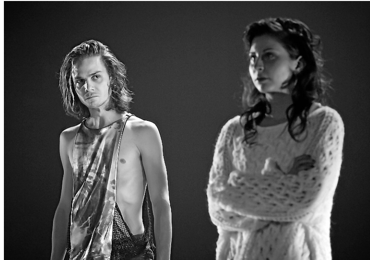
Les interprètes de Faire des enfants donnent l'impression d'éviter l'émotion.

Il y a chez Éric Noël une économie de moyens qui donne l'impression que les personnages ne se disent que l'essentiel: ce qui masque la vérité ou ce qui la révèle dans toute sa brutalité. Il y a aussi une façon de jouer avec la forme qui vise à