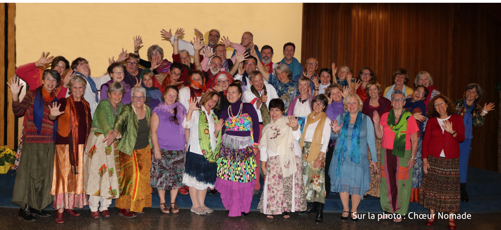
Sur la photo : Chœur Nomade

Quand est venu le temps de se doter d'un nom, c'est celui de Chœur Nomade qui s'est imposé. Plus tard, une choriste a constaté qu'en brassant bien les lettres du mot