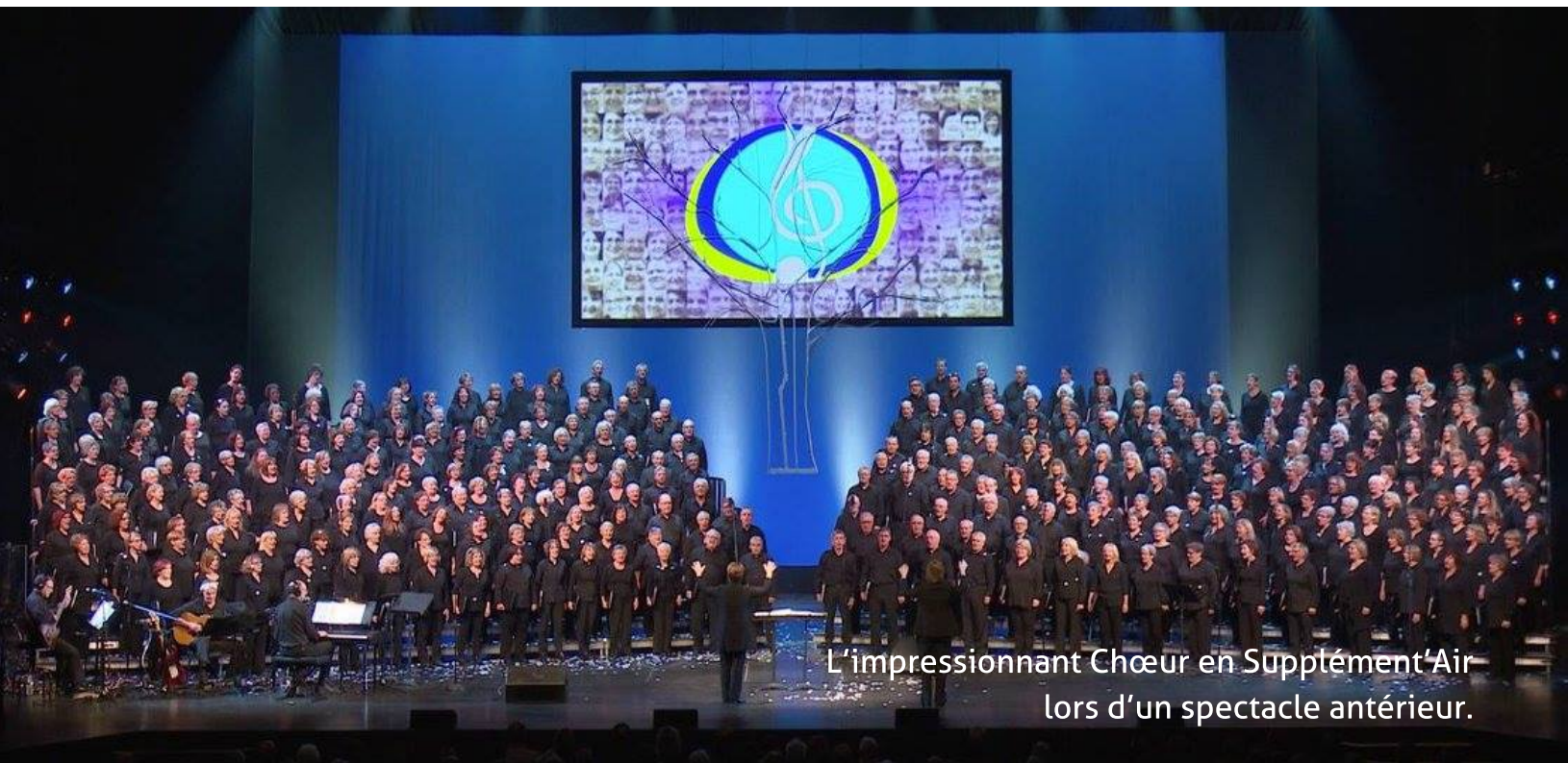
L'impressionnant Chœur en Supplément'Air lors d'un spectacle antérieur.

Le Périple de la chanson francophone en Haute Amérique, vous connaissez? C'était le défi que s'était lancé le Chœur en Supplément'Air cet automne pour son grand spectacle présenté en novembre au Grand Théâtre de Québec.