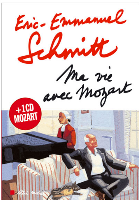
Éric-Emmanuel Schmitt Ma vie avec Mozart Albin Michel, 2005