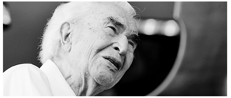
Dave Brubeck a été récompensé pour l'ensemble de sa carrière.

Dave Brubeck aura 90 ans en décembre. «Ce soir, je devrai porter une attelle», dira-t-il enfin en montrant l'annulaire de sa main gauche gonflé par une quelconque excroissance. «L'attelle glisse, je ne peux jouer comme je veux.» La voix s'étrangle et le vieillard finit par lâcher les mots qui lui barrent la gorge: «Et ça me frustre...»