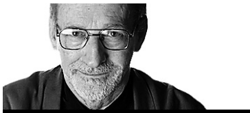
CLAUDE GINGRAS MUSIQUE

Le 33 e Festival de Lanaudière s'ouvre exceptionnellement samedi soir à 19h et, plus exceptionnellement encore, à l'Amphithéâtre Fernand-Lindsay.