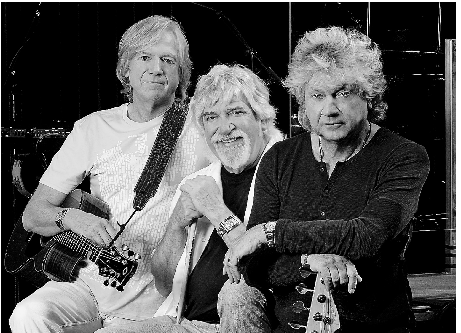
Le trio des Moody Blues: Justin Hayward, Graeme Edge et John Lodge.

Peu après, me raconte Edge, les Moody Blues participent à un très long spectacle au Midem de Cannes. Ils ne devaient pas être de la partie télévisée du spectacle, mais un autre groupe a eu un empêchement et la France les voit chanter Nights in White Satin en direct à la télé. Le lendemain, les Français s'arrachent cette chanson et la compagnie de disques ne fournit plus. Les Moodies rencontreront éventuellement le grand Léo Ferré qui