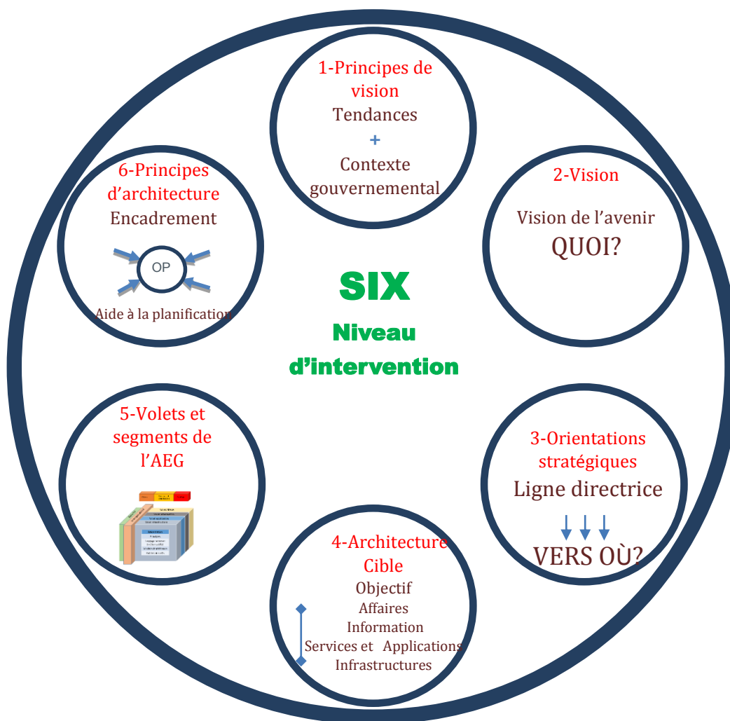
Figure 1. Démarche de réalisation de l'AEG

La définition des orientations stratégiques, élément clé et directeur dans ce processus, s'inscrit dans une démarche globale à l'échelle gouvernementale. Découlant d'une vision clairement énoncée, ces orientations stratégiques indiquent les priorités ainsi que les objectifs communs du gouvernement du Québec. Elles se traduisent par la définition d'une architecture cible, structurée selon le cadre d'architecture TOGAF, en volets et segments, à savoir :